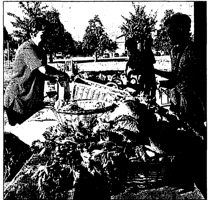
Auf hochwertiges Gemüse und Obst wird grosser Wert gelegt