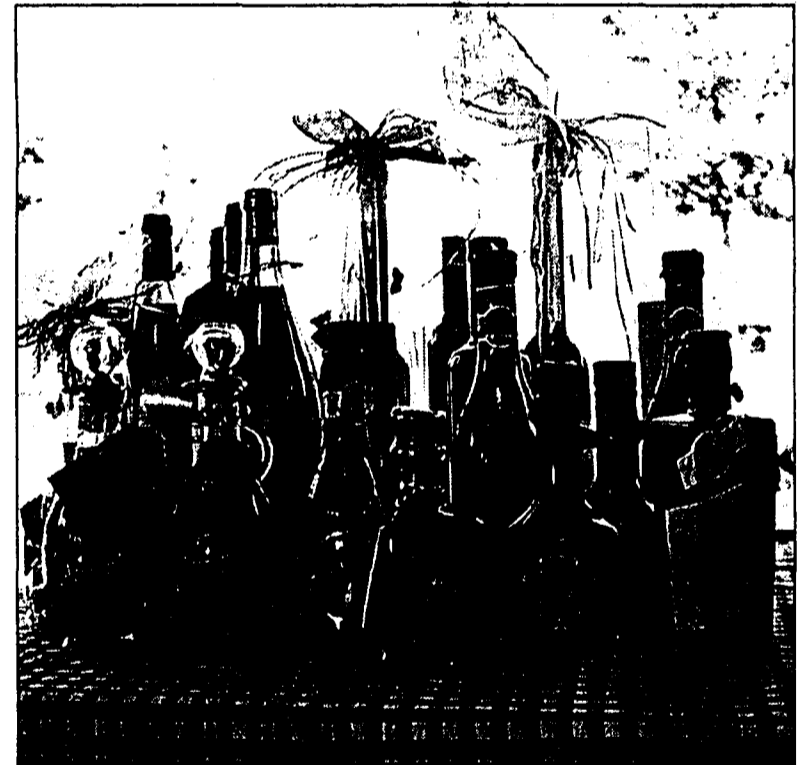
Auch italienische Öle aus der Eigenproduktion sind erhältlich.