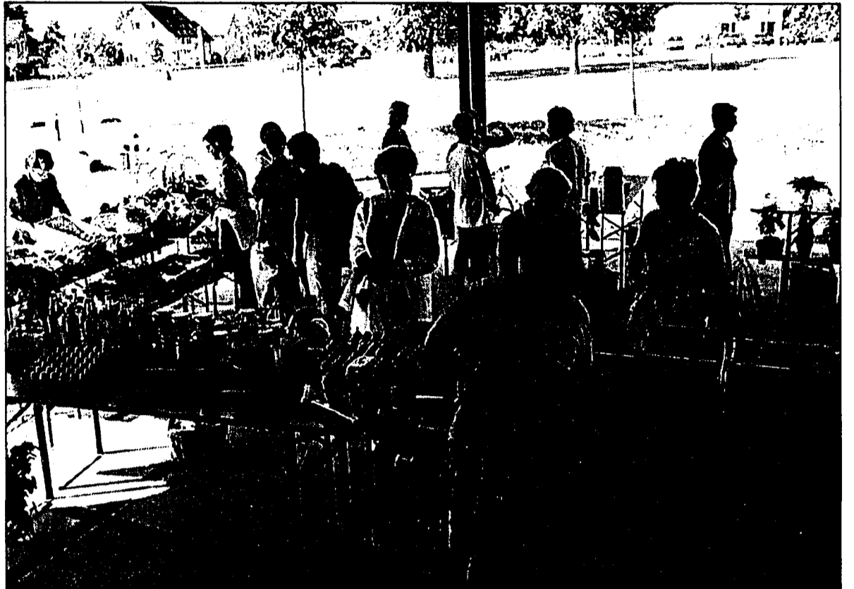
Beim Wochenmarkt in Mauren hat man eine grosse Auswahl von Bioprodukten und Spezialitäten.