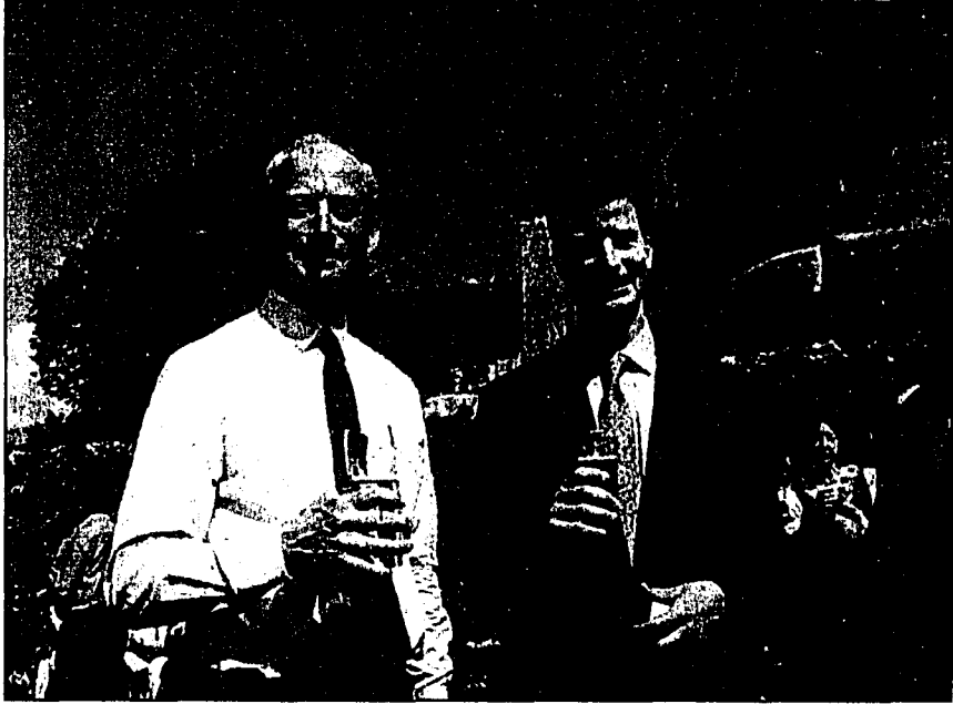
Gute Laune bei einem Glas Bier zusammen mit der Bevölkerung auf der Schlosswiese: S. D. Fürst Hans-Adam und S. D. Erbprinz Alois.

■ Bildimpressionen vom Staatsfeiertag 2000