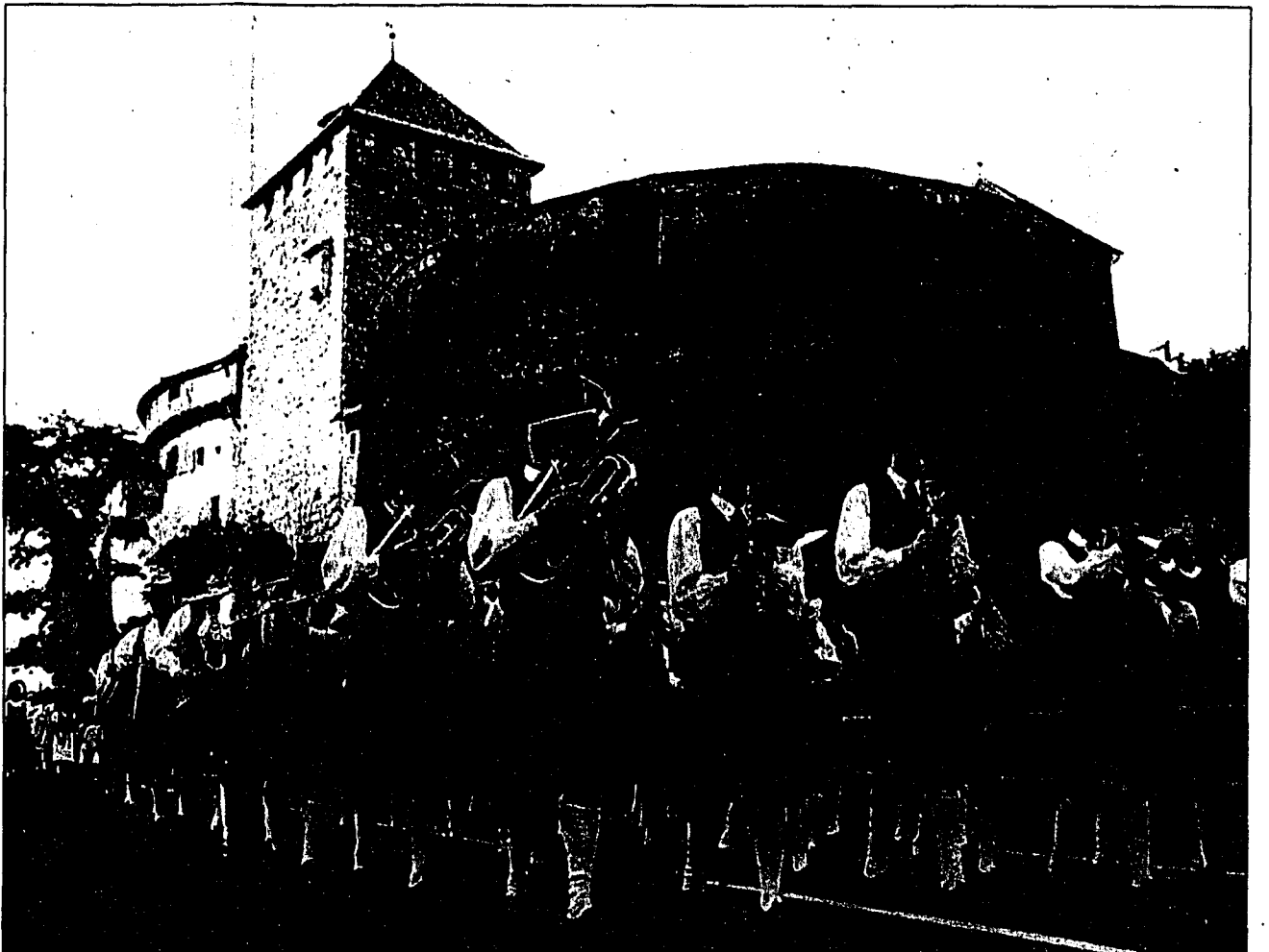
Musikalische Umrahmung der Feierlichkeiten auf der Schlosswiese durch die Harmoniemusik Ruggell.