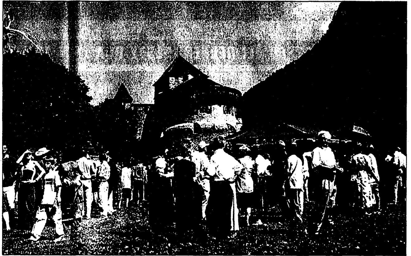
Bilderbuchwetter für ein herrliches Volksfest am gestrigen Staatsfeiertag.