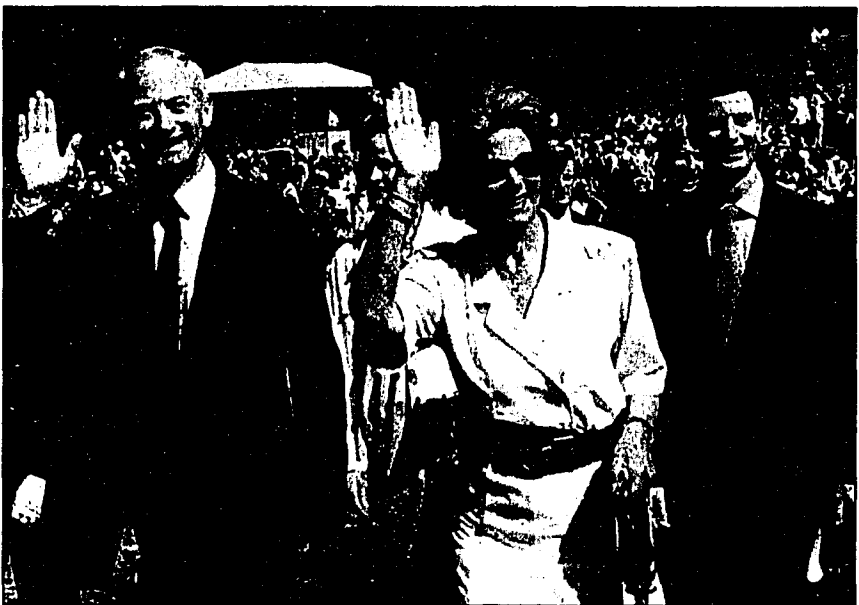
Ein Lächeln für die zahlreich aufmarschierte Bevölkerung: S. D. Fürst Hans-Adam, I. D. Erbprinzessin Sophie, I. D. Fürstin Marie und S. D. Erbprinz Alois.