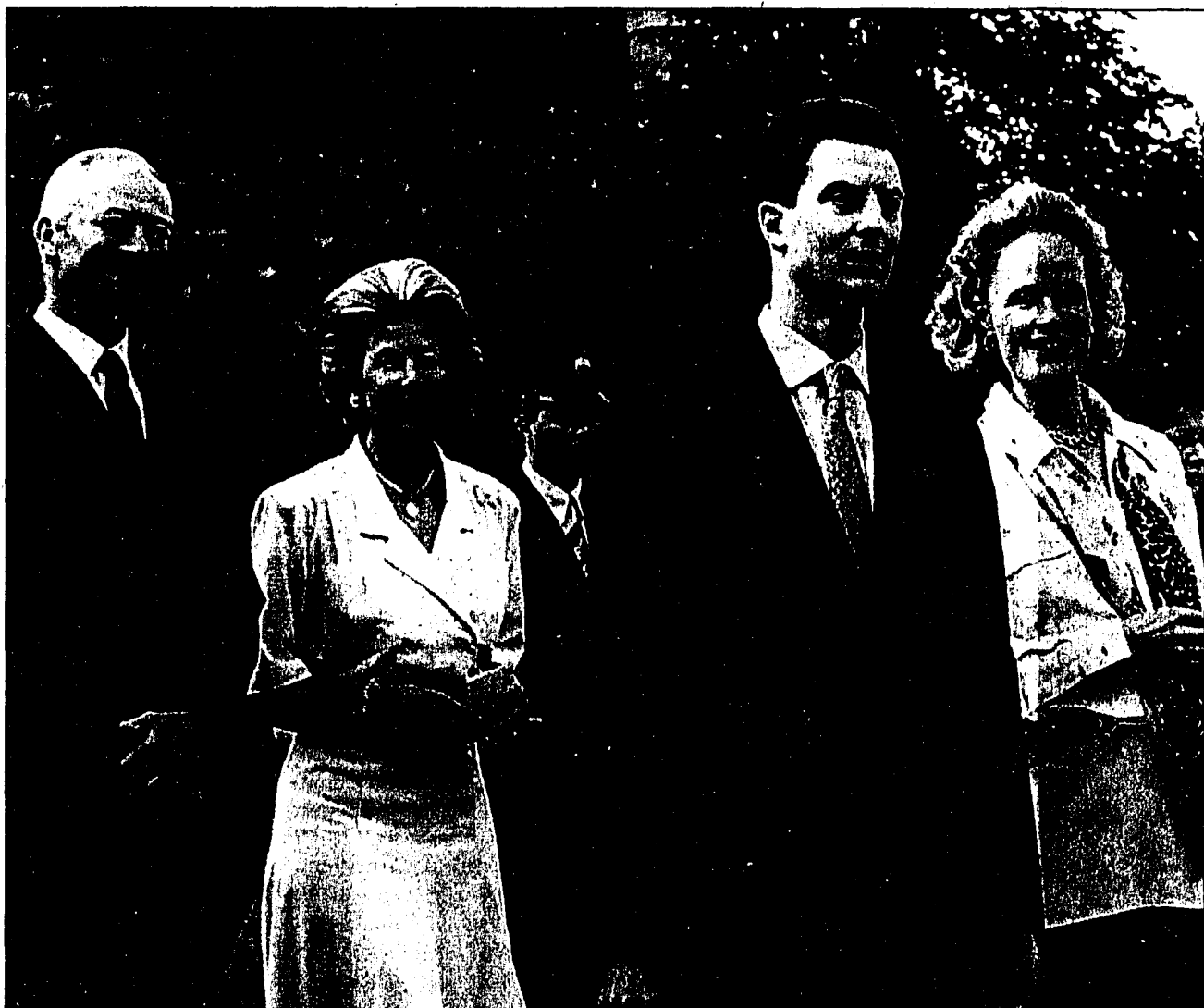
S. D. Fürst Hans-Adam zusammen mit Gattin I. D. Fürstin Marie und dem Erbrinzenpaar S. D. Prinz Alois und I. D. Prinzessin Sophie auf dem Weg zur Schlosswiese.

tionen hinweg mit den politischen Problemen eines Landes auseinandersetzen kann. Besonders für ein kleines Land wie das unsrige ist es wichtig, dass sich jemand frühzeitig mit den Entwicklungen in der Welt und in Europa beschäftigt. Unser kleines Heimatland ist von diesen Entwicklungen sehr viel abhängiger als ein grosses und muss deshalb im Ernstfall sehr viel schneller und flexibler reagieren können, um zu überleben und zu gedeihen. Wir leben im Zeitalter der Globalisierung, die den Kleinstaat in seiner Existenz bedrohen kann, ihm aber auch viele Chancen bietet.