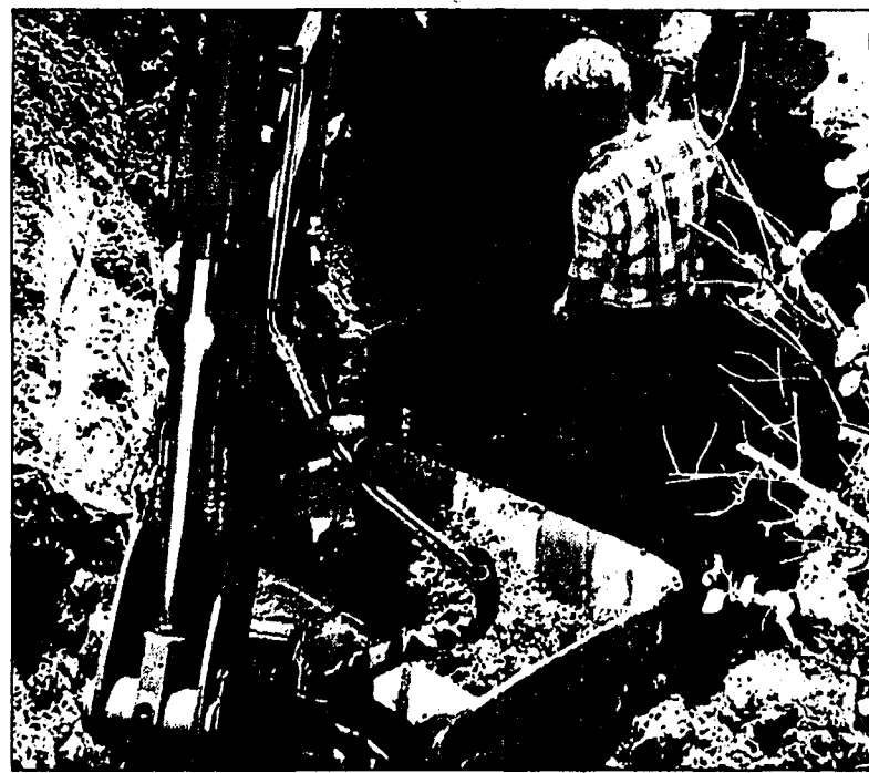
Ob die verschmutzte Erde abgetragen und entsorgt werden müsse, wird vom Amt für Umweltschutz abgeklärt. Es sei jedoch kein Benzin in die Esche gelangt.