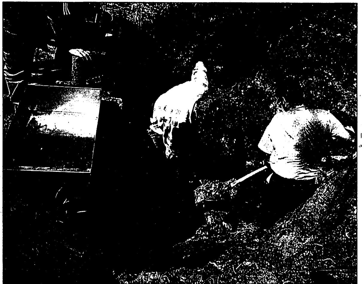
Gestern war man damit beschäftigt, die Sauberwasserleitungen zu entlüften.

Durch die Landespolizei wurden sofort die Freiwillige Feuerwehr Mauren, Stützpunktfeuerwehr Vaduz, das Amt für Umweltschutz und eine Kanalreinigungsfirma verständigt und vor Ort geschickt. Nachdem innert kurzer Zeit die Stelle geortet werden konnte, wo das Benzin austrat, wurde das kontaminierte Wasser-Benzingemisch in ein Fangbecken, in das ein Tauchschacht installiert wurde, abgepumpt.