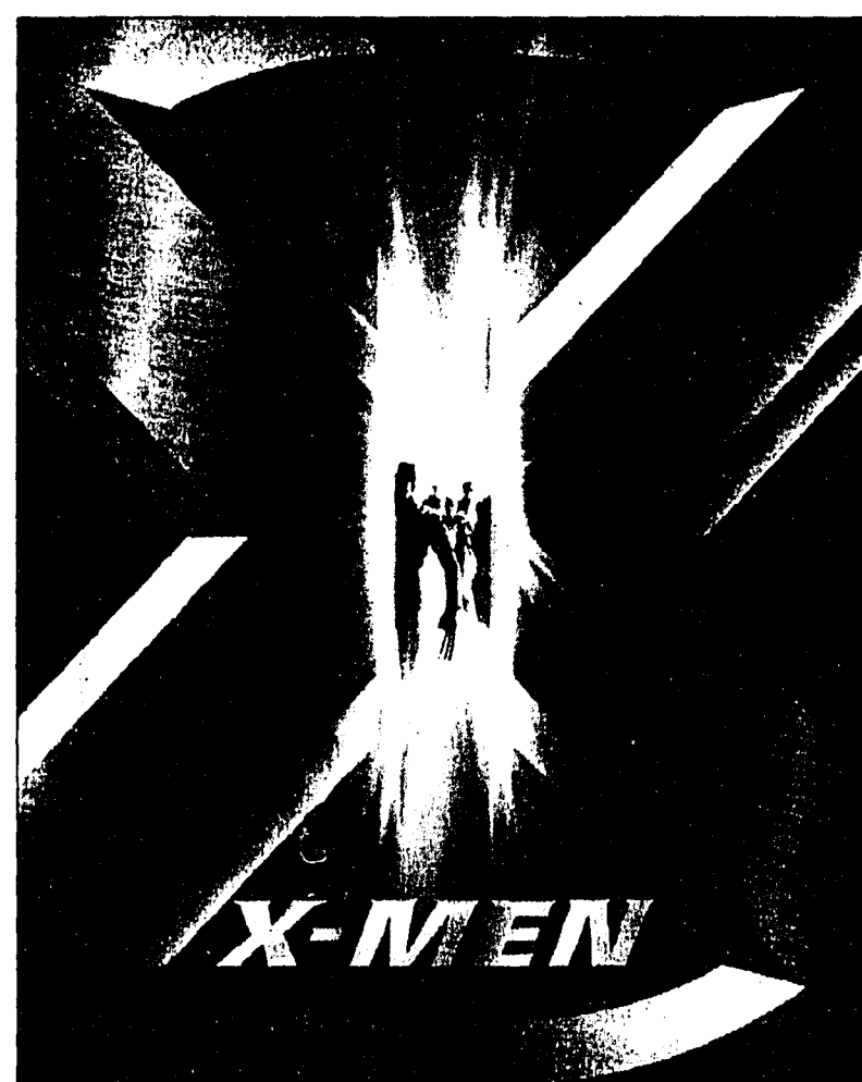
Der Actionhit «X-Men» feierte vergangenen Mittwoch in Locarno seine Schweizer Premiere.

Mit Schauspielern wie Hugh Jackman, Patrick Stewart, Ian McKellen, Famke Janssen, James Marsden, Halle Berry, Ray Park, Rebecca Romijn-Stamos und Anna Paquin wird der Film sicher ein Action-Hit. Ausseiter seit Geburt, sind die X-Men Resultat der nächsten menschlichen Entwicklung. Jeder einzelne der Mutanten besitzt eine einzigartige genetische Mutation, die ihm ausserordentliche Kräfte verleiht. Unter Anleitung von Professor X versuchen die X-Menschen das Böse zu bekämpfen. Trotz all diesen Bemühungen werden die X-Men von den Menschen abgelehnt. Dazu kommt noch, dass Magneto, einer der mächtigsten Mutanten der Welt, nicht an den Frieden zwischen Menschen und Mutanten glaubt und nur ein Ziel hat: die Herrschaft über die Erde. Weitere Informationen zum Kinofilm «X-Men» sind unter www.x-men.ch zu finden.