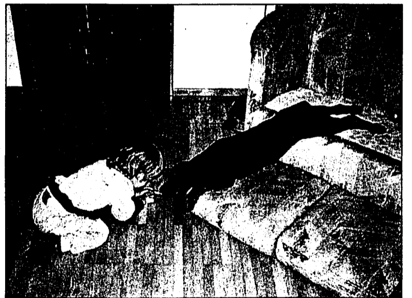
Rottweiler sind als «Kampfhunde» verschrien, zu Unrecht, denn sie lieben es, wie alle anderen Hunde auch, zu spielen, spielen und nochmals zu spielen.