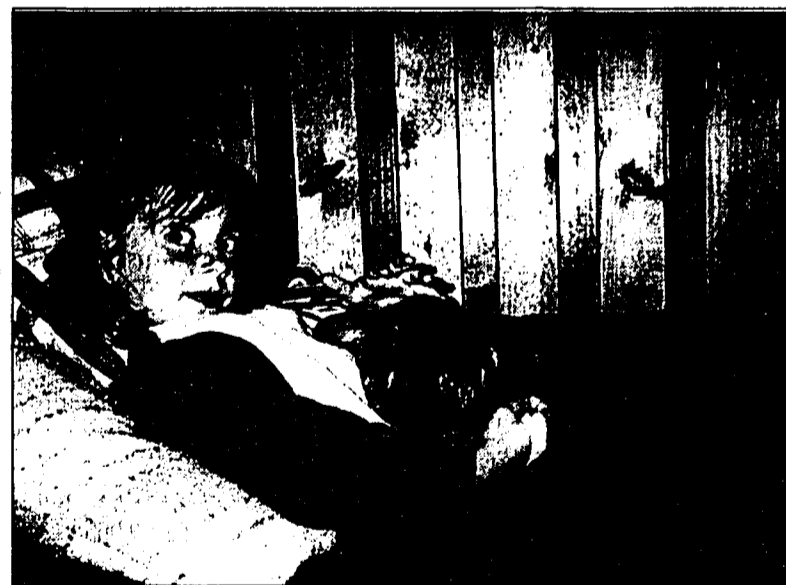
Hunde sollten schon als Welpen innerhalb einer Familie aufwachsen, sie lernen dann, Kinder und auch Regeln zu akzeptieren.

Wer den Rottweiler Club besser kennenlernen möchte, erhält unter der Tel. Nr. 0043/6641022449 (Günter Aigner, Ludesch) weitere Auskünfte.