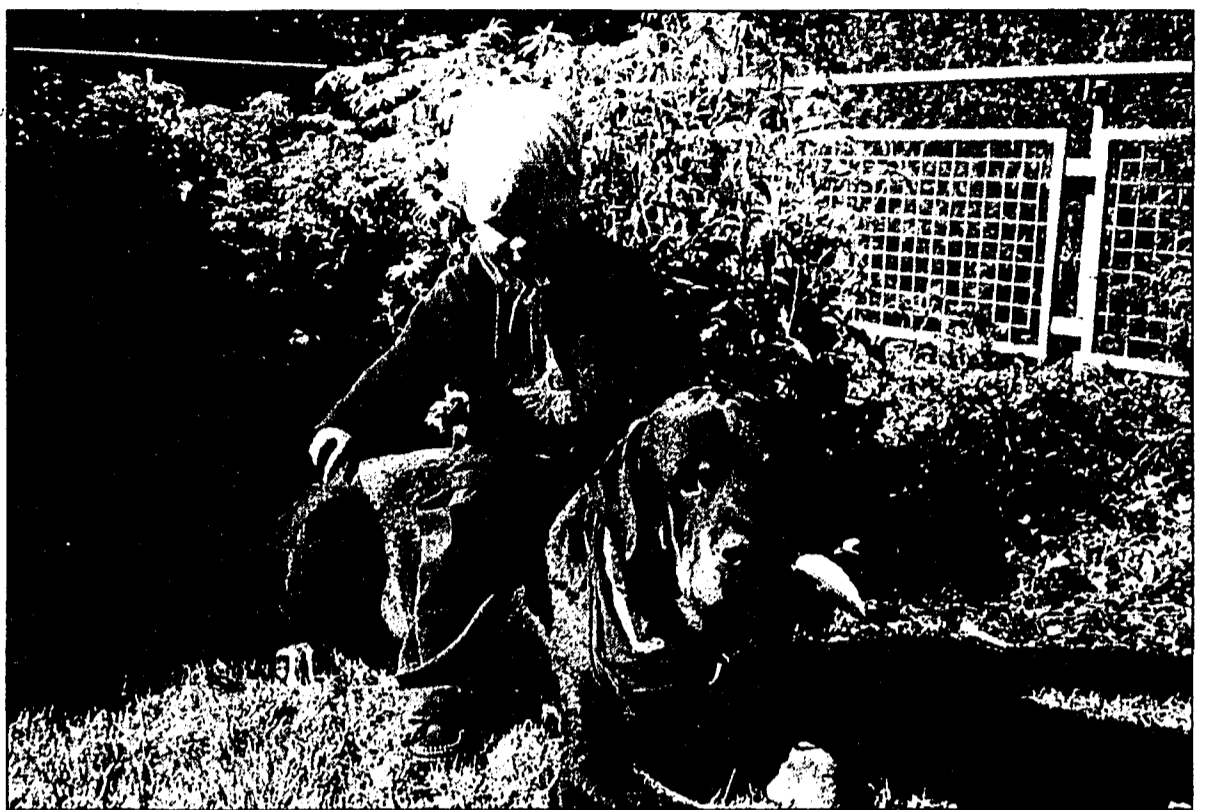
Der Rottweiler ist ein Hund, der sich hervorragend als Familienhund eignet, wenn er so erzogen wird.

Da diese Hunde auf brutalste Weise (zum Teil mit Zwinger- und Kettenhaltung, Stockhieben, Elek-