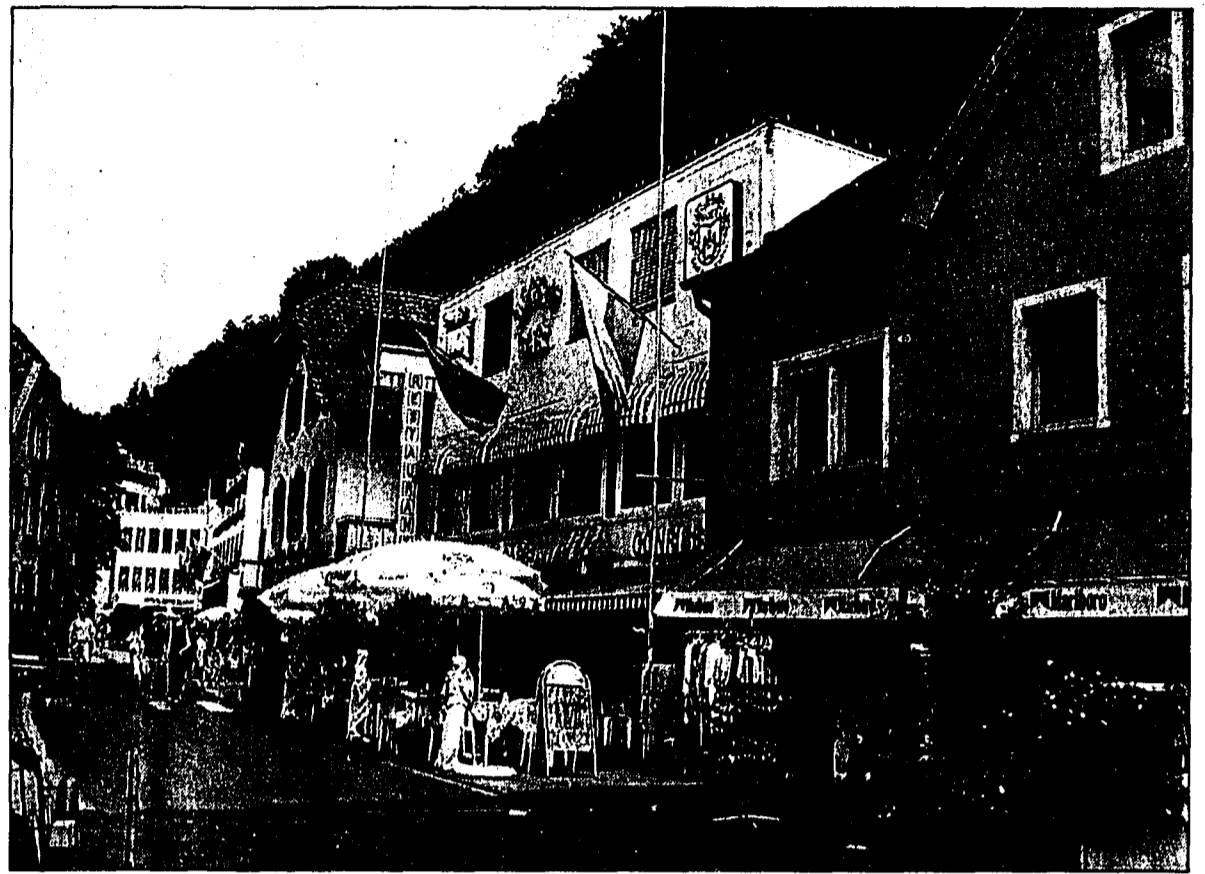
Ein Teil des Geschäftshauses Rechsteiner, das Café Wolf und das frühere Anwesen «Dürr-Ospelt» (im Bild von rechts) im Vaduzer Städtle werden bald durch Neubauten ersetzt.

Die Vorarbeiten zu diesen Neubauten beginnen mit der Sicherung der Schlosshalde gegen den Bergdruck. Das heisst, dass hinter der Häuserzeile der Hang abgegraben und – ähnlich wie es derzeit beim Landesmuseum der Fall war – mit untereinander verbundenen Beton-elementen gegen Rutschungen gesi-