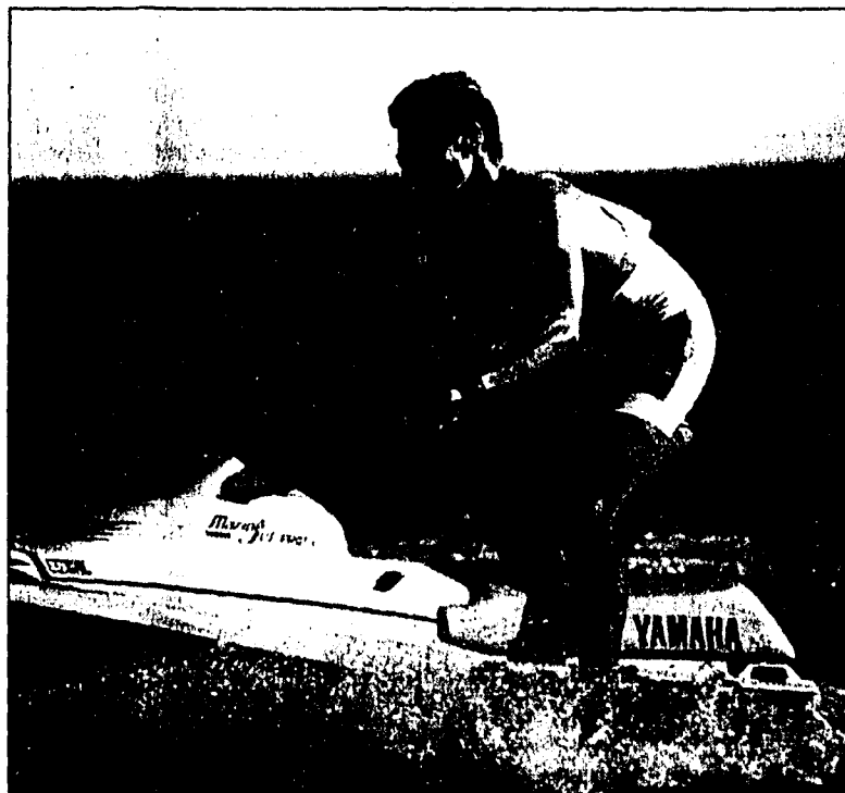
Damit die Ferien «nicht in die Hosen gehen», sind einige wichtige Regeln zu beachten!

oder vergiss es.» Im Fall eines Durchfalles trinkt man Flüssigkeit mit einem Teelöffel Salz, acht Teelöffeln Zucker sowie einem halben Teelöffel Backpulver pro Liter.