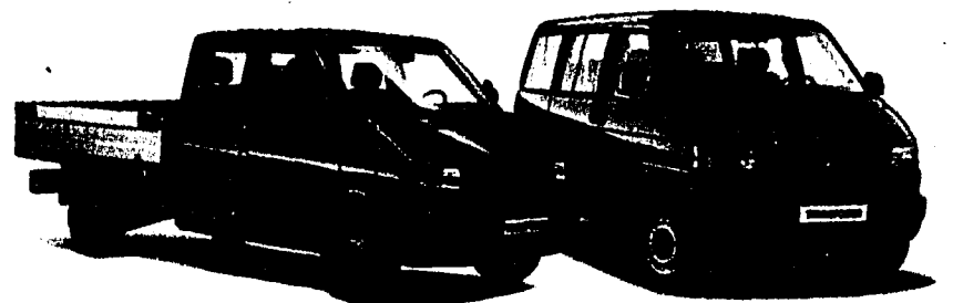
VW Transporter Doppelkabine

Transporter fahren - Dauersparen! Mit dem 102 PS TDI-Motor drückt der VW Transporter «Swiss Profi» den Ver- brauch auf historische Tiefstwerte. Und die Rentabilität auf ungeahnte Höchstwerte. 6,8 Liter auf 100 km: so wenig braucht er, um seine Vorzüge voll auszuspielen: also die unschlagbare Zuverlässigkeit, die hohe Flexibilität, das lückenlose Sicherheitskon- zept. Schon ab Fr. 27 680.- macht sich der VW Transporter unermüdlich für Sie ans Werk. Ihr VW Nutzfahrzeugvertreter stellt gerne Ihren Wissensdurst.