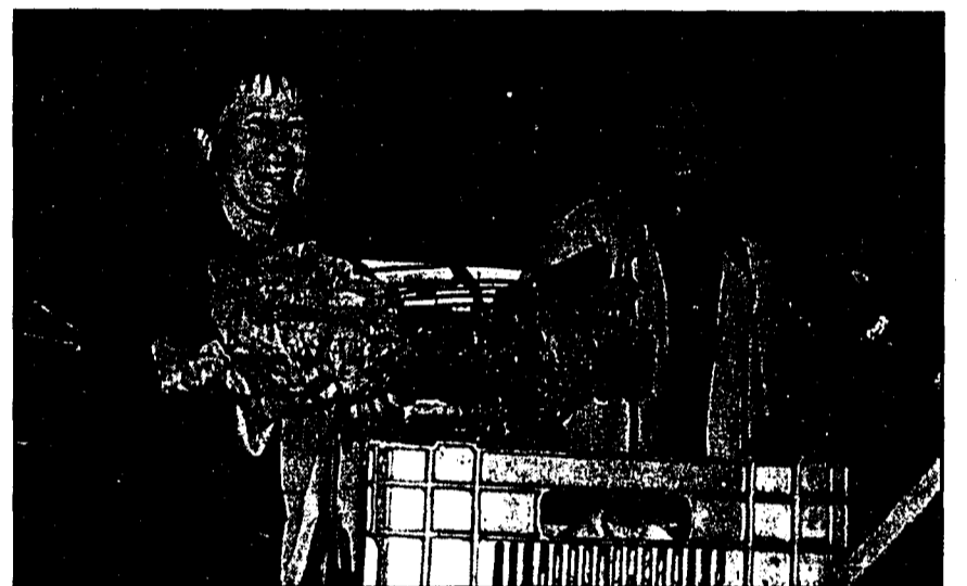
«Ist der Kopfsalat auch wirklich frisch?», kontrollieren diese beiden Frauen.

Bewusstsein für regionale Produkte zu fördern und den direkten Kontakt zwischen Produzenten und Konsumenten zu fördern ist damit erreicht worden. Auch auf Seiten der Produzenten waren nur positive Stimmen über die