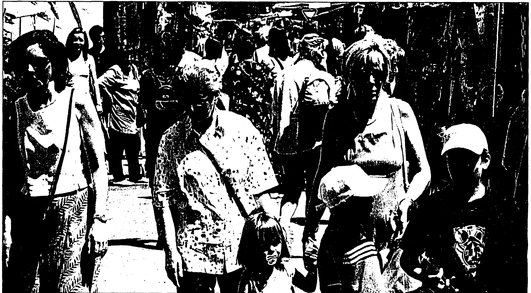
Ob Petrus auch am kommenden Wochenende so schönes Wetter bereit hält, wie im vergangenen Jahr?

In einem Gespräch mit dem «Vater» des Balzner Jahrmarktes und Präsident des veranstaltenden Verkehrsvereins,