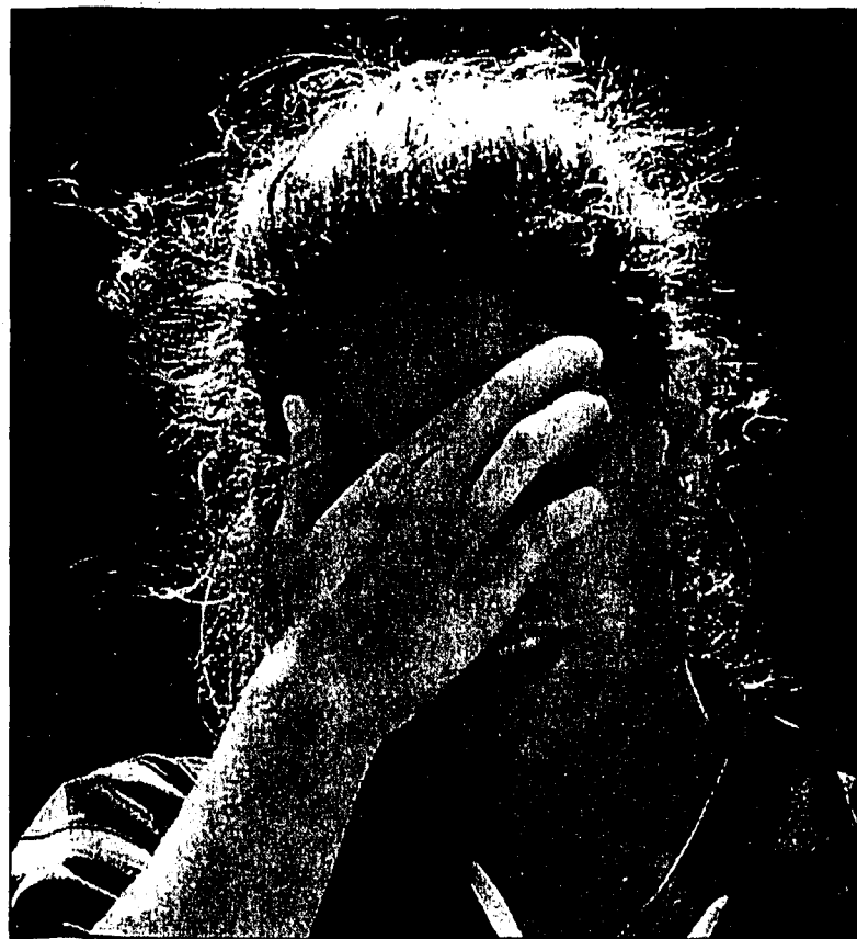
Für Patty Schnyder setzte es erneut eine Erstrunden-Niederlage.