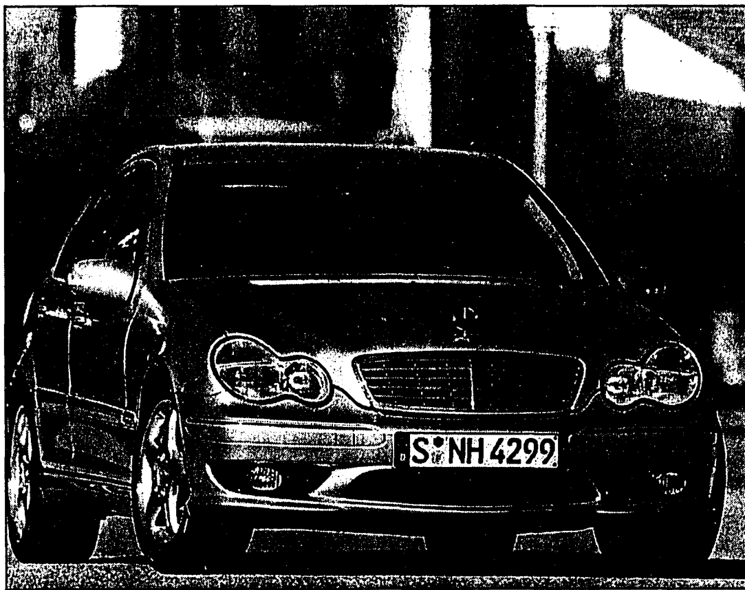
Ein Augenschmaus: Die neue C-Klasse von Mercedes.

Die neue Frontschürze mit harmonischer Linienführung, auffälligen Kühlluftöffnungen und integrierten Nebelscheinwerfern betont unmissverständlich