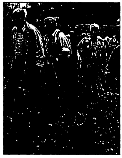
752. Wanderung der Gipfelstürmer und Gipfelgeniesser

Regelmässig informieren wir unsere Leserschaft über die Aktivitäten des Alpenvereins. Darüber hinaus werden die LAV-Seniorenwanderungen aber auch jeweils im Radio-L-Veranstaltungskalender um 9.15 und um 11.15 Uhr angekündigt. Über Ganztagswanderungen wird am Vortag auch um 16.15 Uhr informiert.