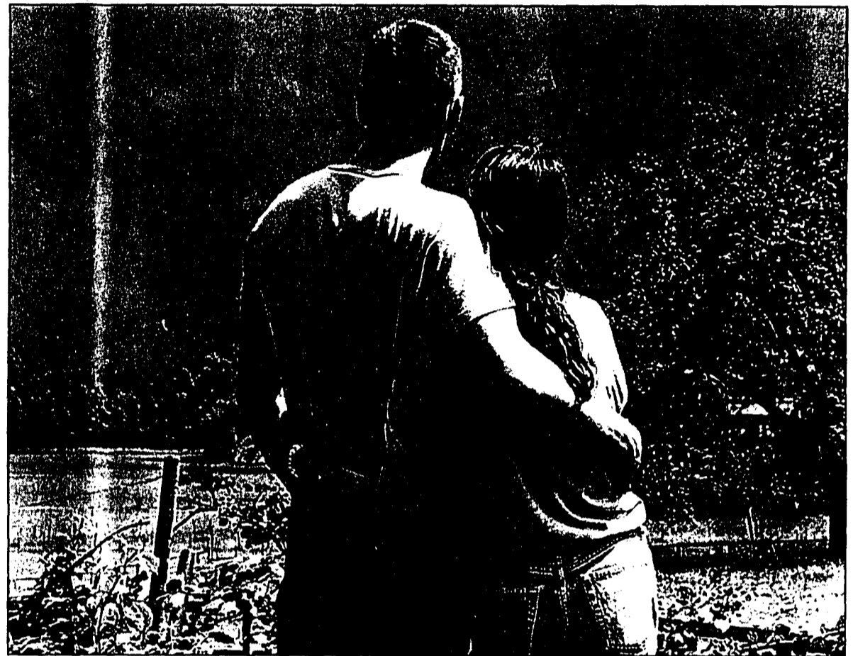
Niemand kann die Liebe herbeidenken oder gar erzwingen. Sie kommt und geht wann sie will. (Archivbild)

«Als er dann doch auf mich zukam, konnte ich mein Glück kaum fassen. Wir haben kurz geredet und als unsere Blicke sich später streiften, war das Kribbeln im Bauch un-