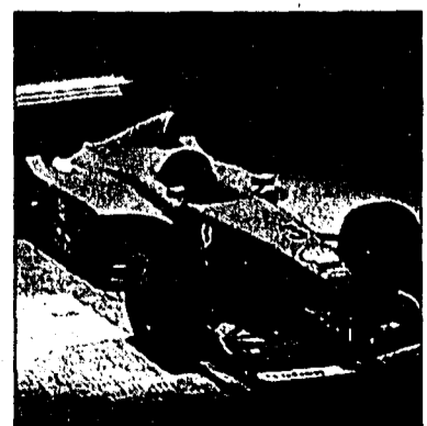
... richtige Formel-1-Bedingungen.

dem Masse, in dem der Spieler dazulernt und besser wird, spielt auch das Tuning des Fahrzeugs eine immer grössere Rolle. Im Grand Prix- oder Meisterschafts-Modus spiegeln die Rennen die realen Grossen Preise wider, bis hin zu einzelnen Trainingsrunden und dem ganzen Qualifying. Daneben gibt es noch den Modus «Freies Training», bei dem die Spieler jeden der Kurse ohne Zeitdruck und andere Fahrzeuge