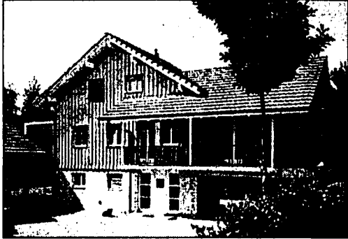
Holzfassaden und Balkonbrüstungen lassen sich ökologisch unbedenklich schützen.

Für den Fachmann und den Hobby-Maler ist es eine grosse Hilfe, dass es jetzt eine wetterfeste Lasurbeize gibt. Diese farbige Aussenhaut kann nicht blättern. Das Schweizer Aqua-Stop-System für die Behandlung von neuen und alten Holzverschalungen, Balkonbrüstungen, Chalets und Dachunterschichten sowie für den Innenbereich besteht aus besonders wetterfesten und wasserresistenten Produkten. Sie sind lösemittel- und giftfrei und ökologisch absolut unbedenklich. Ihre Anwendung sichert eine neue, langzeitliche Werterhaltung und spart bedeutende Unterhaltskosten. Weitere Infos bei Böhme AG, Lack- und Farbenfabrik, 3097 Liebefeld, Telefon: 031 / 971 11 63.