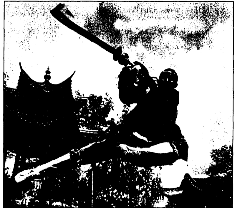
Am Mittwoch, den 26. April zeigen die Shaolin-Mönche im Vaduzer Saal, wie man durch Geisteskräfte den Körper beherrscht.

Aussergewöhnliche Körperbeherrschung, dynamische Kung-Fu-Elemente, Kampfkunst und Präzision, die herausragenden Momente der Shaolin-Show bewegen das Publikum weltweit.