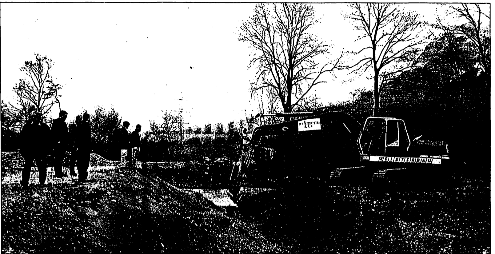
Interessanter Augenblick: Nach dem Durchbruch des Damms beginnt sich das Wasser langsam den Weg in das neue Bachbett zu bahnen.

Die Binnenkanalmündung in Ruggell wird neu gestaltet - Erleichterung für Fische