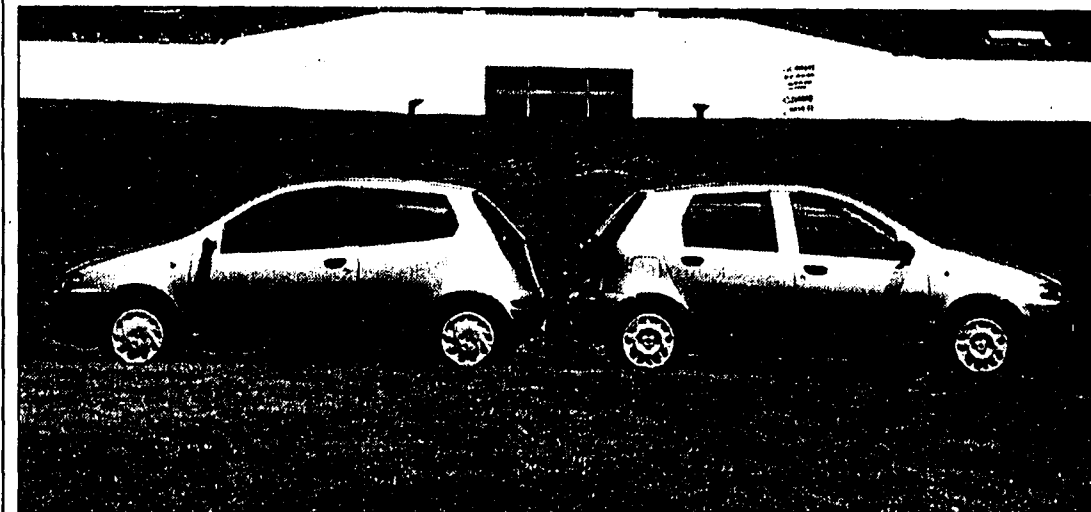
Mit dabei an der Ausstellung, die heute Samstag und morgen Sonntag zwischen 10 und 17 Uhr geöffnet ist, ist der Fiat Punto

Die Winkelgarage in Schaan präsentiert Fahrzeugmodelle von Alfa Romeo, Chrysler-Jeep und Fiat