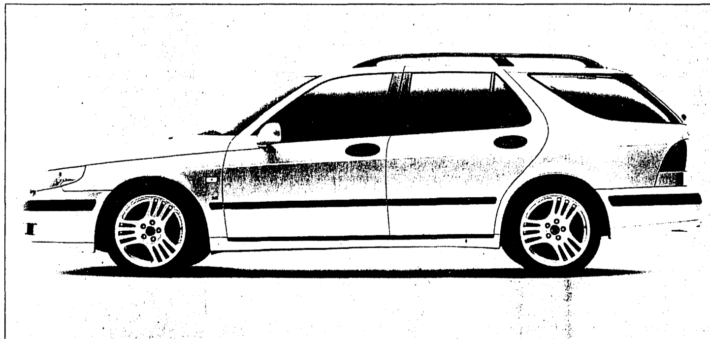
Viele Attraktionen wie eine Hüpfburg, Minigolfparcours und natürlich die Rover- und Saabpalette erwarten Sie am Wochenende. Mit dabei ist auch der Saab Limited Edition (Bild).

erhalten Sie den attraktiven Saab 9-5 Combi «Limited Edition» bereits ab 51 150 Franken. Über weitere Motor- und Ausstattungsvarianten sowie zusätzliche Optionen berätet Sie am Wochenende die Garage Max Beck-Crew, im Rösle 7, in Schaan.