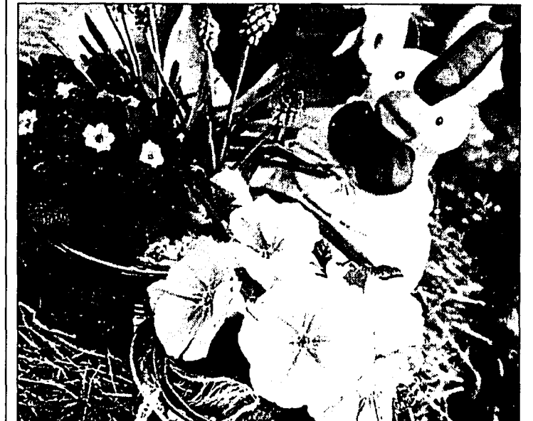
Frühjahrsausstellung bei der Gärtnerei Jehle, Im Lohma 17, in Schaan, heute Freitag und morgen Samstag.

Bei der Gärtnerei Jehle in Schaan sprissen die Pflanzen und Ideen um die Wette