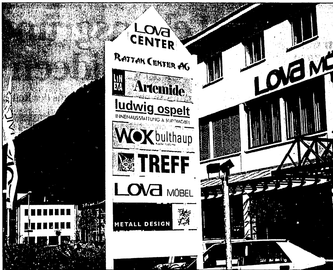
Eine Gesamtausstellung zum Thema schöner Büroalltag zeigt das LOVA-Center ab Dienstag, 21. März bis Freitag, 24. März jeweils zwischen 10 und 18 Uhr.

Doch wo sind die Fachleute? Ospelt Elektro - Telekom AG hat den Bereich Telekommunikation 1998 aufgebaut. Seit Beginn des Jahres 2000 ist Ospelt