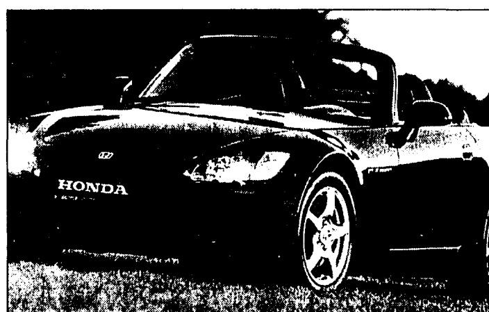
Die offizielle FL-Vertretung für Honda-Automobile, die K-mobil AG in Schaan, zeigt heute und morgen Honda-Highlights wie beispielsweise den S2000

einzigartig hohe spezifische Leistung von 120 PS pro Hubraum auf, erfüllt dabei aber sowohl die D3- bzw. die EU-2000-Norm als auch die kalifornischen LEV-Standards. Weitere Infos über die K-mobil AG gibts auch im Internet unter: www.k-mobil.com oder E-Mail: eugen@k-mobil.com . Der Honda-Frühlingsevent ist heute Samstag und morgen Sonntag jeweils zwischen 10 Uhr und 17 Uhr geöffnet. Die BesucherInnen werden ebenfalls von der Firma Selecta mit Kaffee und Mineral bedient.