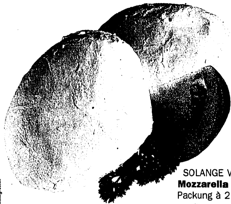
SOLANGE VORRAT Mozzarella Alfredo Packung à 2 x 150 g