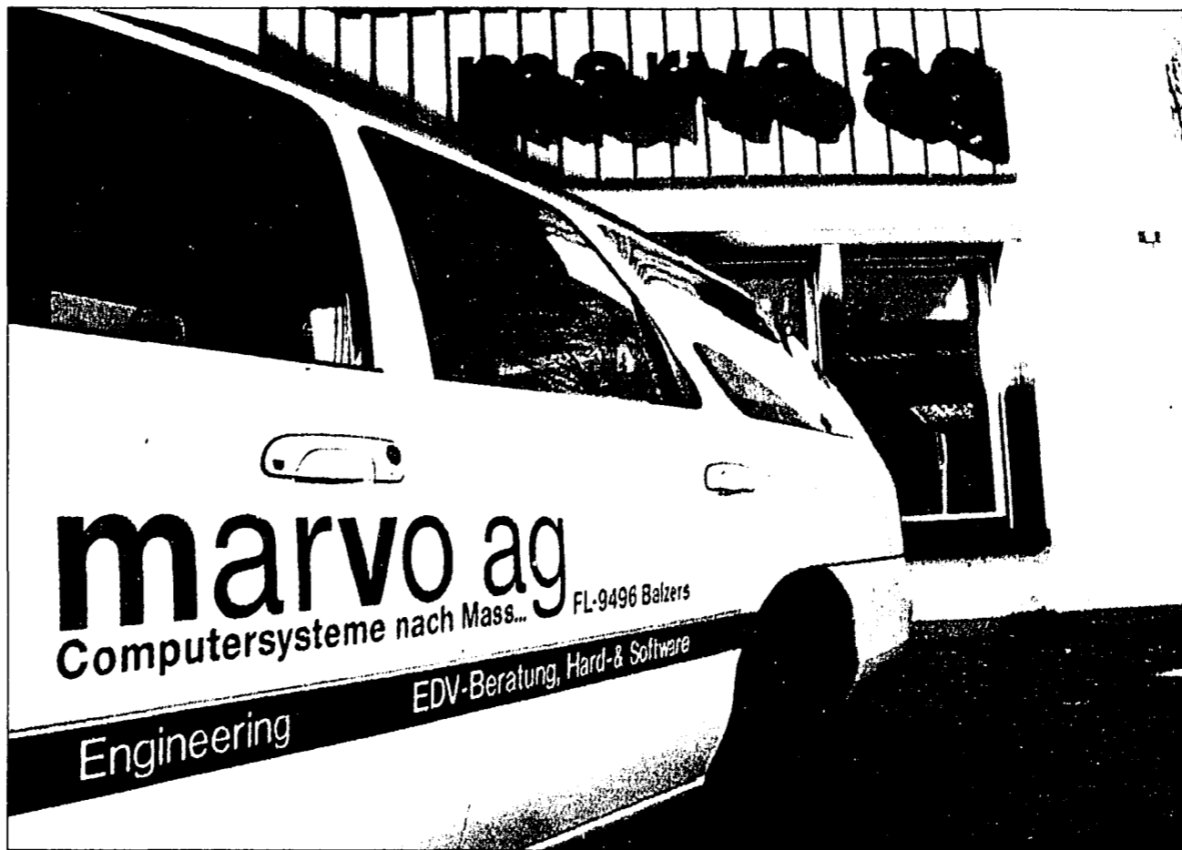
Büroautomation nach Mass. Was das bedeutet und wie es umgesetzt wird, zeigt die marvo ag in Balzers.

Ausgestattet mit einer optionalen Druckerschnittstelle arbeiten die Geräte als leistungsstarke Laserprinter mit einer Druckauflösung von 600 Punkten pro Zoll (dpi). Mittels einer zusätzlichen Netzwerkkarte können Sie ausserdem in bereits bestehende Netzwerke integriert werden. Diese synergetische Kopierer/Drucker-Auslegung bildet die Basis für das innovative Archivierungssystem HDS zur gesamten Bürodokumentation: Nach Wahl der Archivierungsfunktion scannt das Gerät die gewünschten Seiten ein und gibt sie als Druck aus. Die