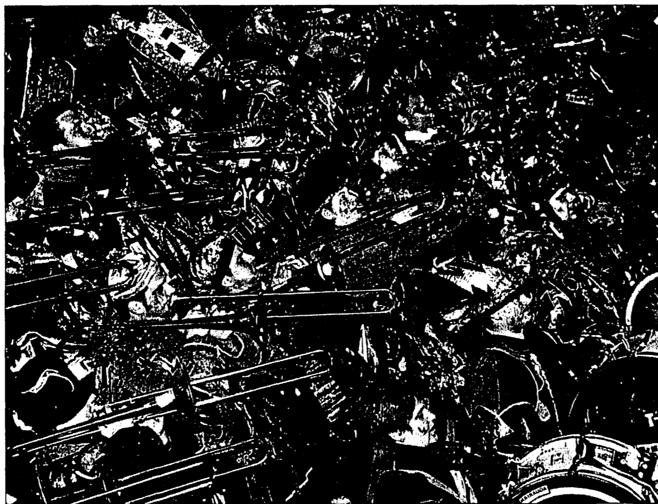
Jede Guggenmusik durfte in Balzers zwei Stücke ihres Repertoires zum Besten geben.