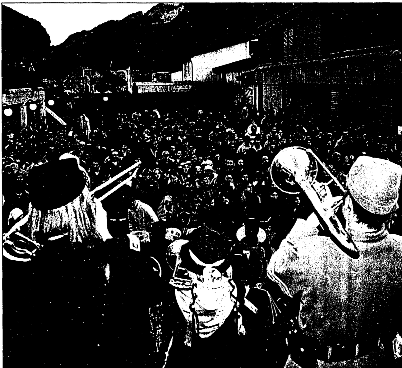
Am Monsterkonzert in Balzers erfreuten sich gestern Abend wieder zahlreiche Guggenmusikfans.