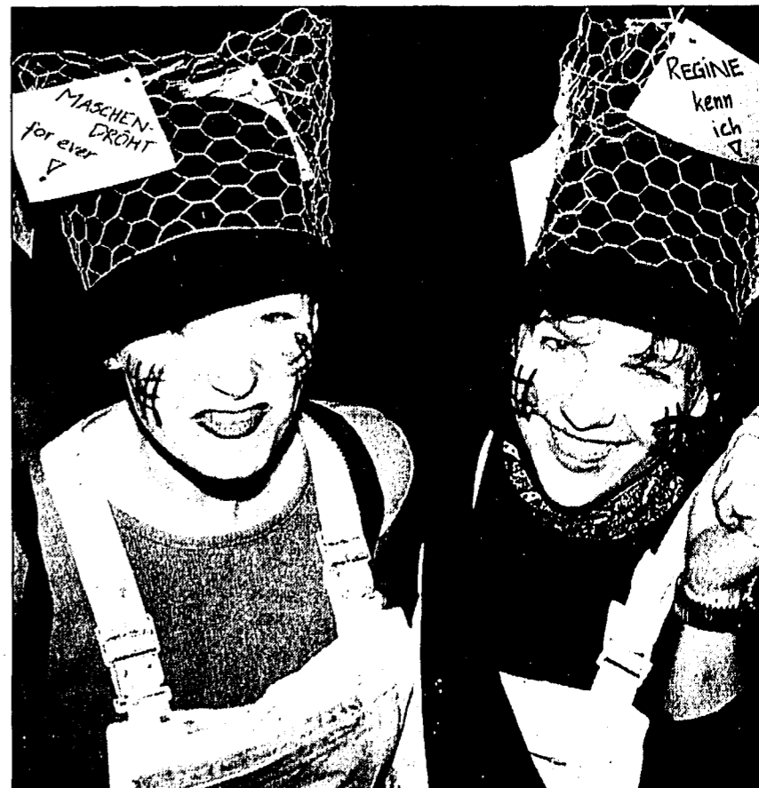
«Maschendrahtzaun»: Die Geschichte der unglücklichen Nachbarin wird auch in Ruggell zum Gespött.