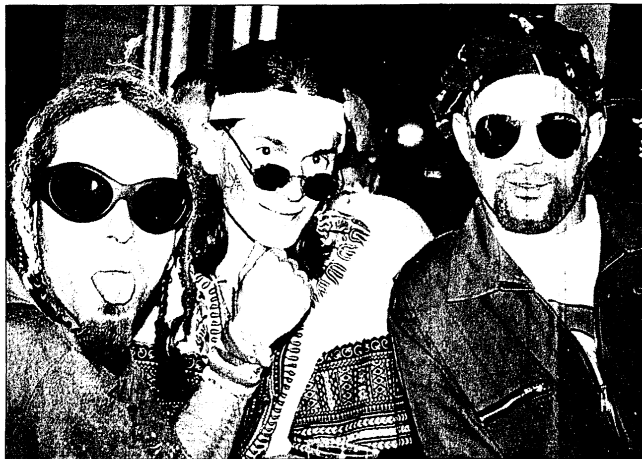
Der Faschnachtsball des FC Ruggell ist jedes Jahr wieder ein lustiger und fröhlicher Anlass.