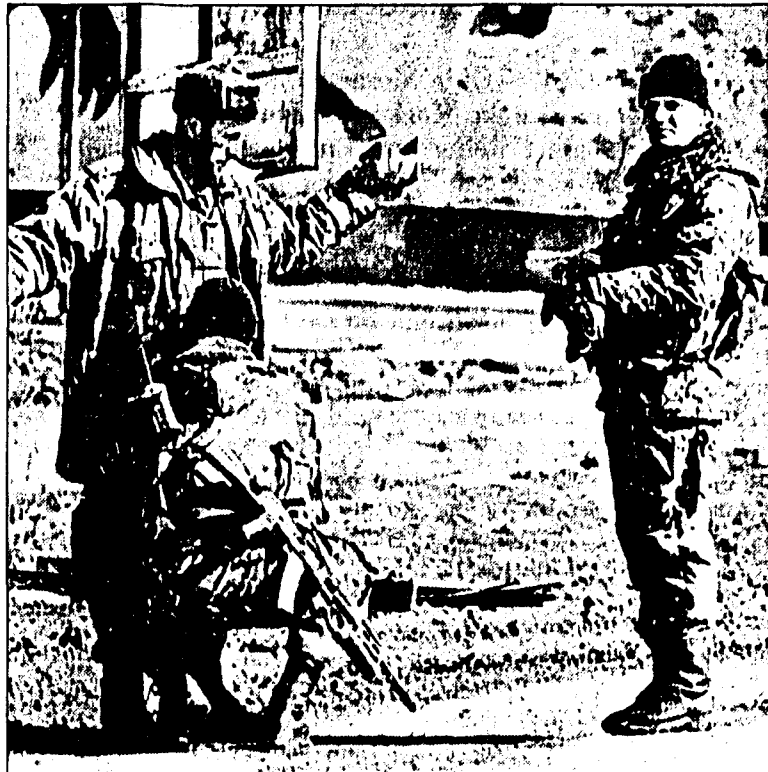
Russische Soldaten überprüfen an einem Checkpoint einen Tschetschenen.

Von einem Sieg Russlands im Tschetschenienkrieg könne keine Rede sein