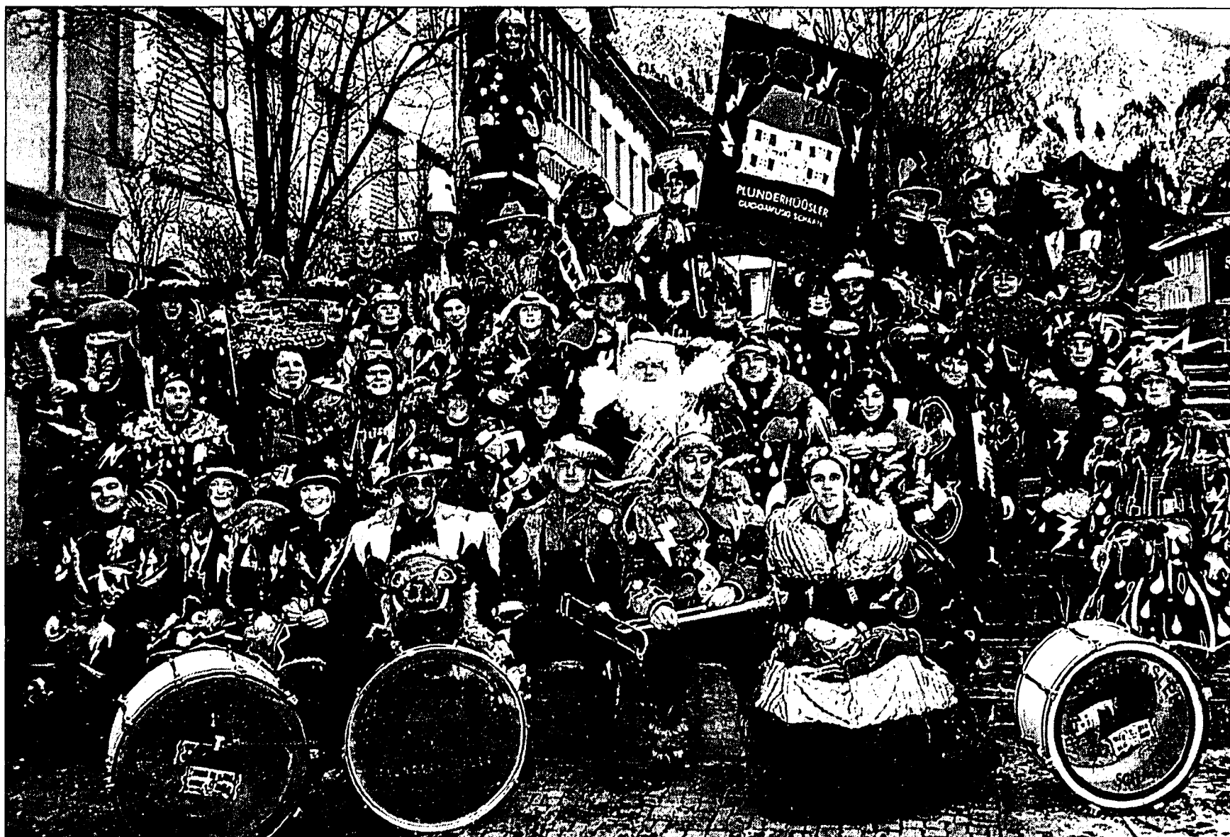
Das Motto «Sauwätter» stellten die Plunderhüusler an ihrem traditionellen Familien-, Freundes- und Gönnerabend vor. Die Kostüme sehen einfach prächtig aus.

Zwei Wochen später: Generalversammlung: Der Präsi (nicht mehr lange) ermahnt zur Ruhe. Die Generalversammlung bestimmt den Sitzungsleiter. Der Vorstand wird entlastet und von der GV neu gewählt. Neumitglieder werden ins Probejahr aufgenommen oder nicht. Jetzt zählen die Plunderhüusler 54 Aktivmitglieder. Der Präsi (jetzt wieder) ermahnt zur Ruhe. Jetzt wird es endlich mal interessant. Die Mutter aller Wahlen. Das kommende