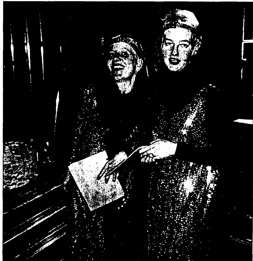
Jede Menge Humor wird beim Plunderball am Freitagabend geboten.

Der 11. 11. 11.11 Uhr: Fasnachtsbeginn: Am 11. November um 11.11 Uhr hält sie Einzug, unsere ach so liebe närrische Zeit. Kleider von längst vergangenen Fasnachten werden aus den düstersten Ecken diverser Estriche hervorgeholt. An diesem speziellen Tag reaktiviert jeder Guggger sein persönliches Lieblingskleid. Die Fasnacht wird