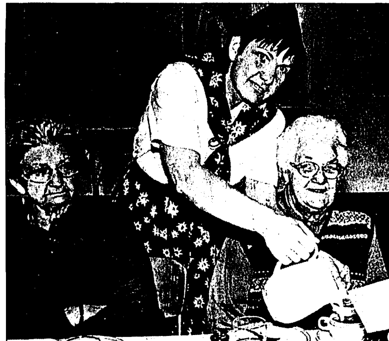
Der Frauenverein Balzers führte erstmals in Balzers einen Senioren-Fasnachtsnachmittag durch. Den Gästen wurde ein unterhaltsamer und humorvoller Mix aus Witzen, Sketchen und Musikeinlagen geboten. Der gelungene Anlass fand im kleinen Gemeindesaal statt, welcher zu diesem Zweck fasnächtlich dekoriert worden war.