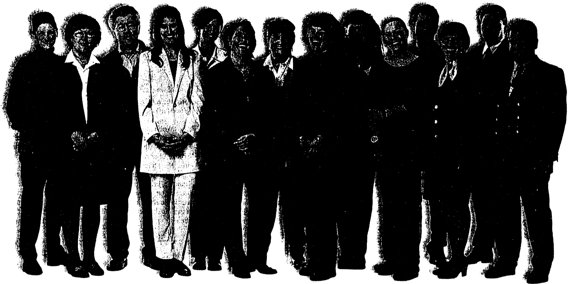
TOP FIT für die Zukunft: das Team der LKK mit ihrem Verwaltungsrat.