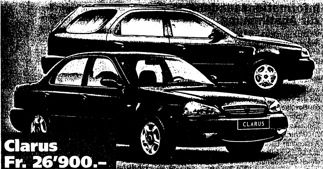
Clarus Fr. 26'900.-

Der Star seiner Klasse: 1793 cm 3 , 110 PS, 5-Gang-Getriebe oder Automat (Option), Full-size-Airbags, ABS, Klima auf Wunsch, Fr. 20'500.-.