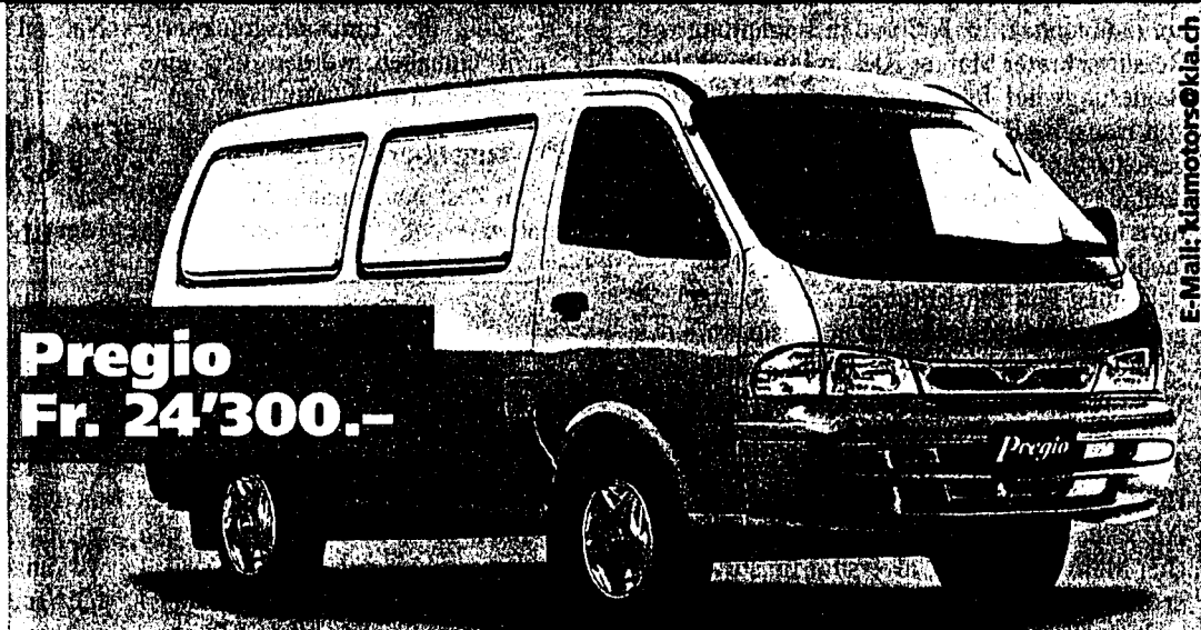
Pregio Fr. 24'300.-

Das Schnäppchen des Jahres: 1324 cm 3 , 64 PS, 5-Gang-Getriebe oder Automat (Option), Fr. 12'620.-, Pride Wagon Fr. 13'625.-.