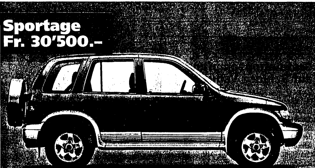
Sportage Fr. 30'500.-

Sieben Reiseplätze erster Klasse: V6 2497 cm 3 , 165 PS oder 2902 cm 3 Turbodiesel, 126 PS, 5-Gang-Getriebe oder Automat (Option). Zwei grosse Schiebetüren, multifunktionelle Sitzkonfiguration. ABS, Airbags für Fahrer und Beifahrer, Komplett-Ausstattung, Fr. 36'850.-, Turbodiesel Fr. 38'850.-.