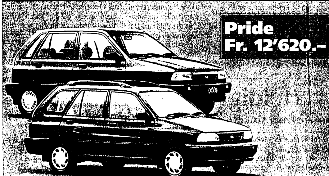
Pride Fr. 12'620.-

*ausser Modell Pride: Fr. 1000.- Sonderprämie. Aktion gültig bis 30.6.00.