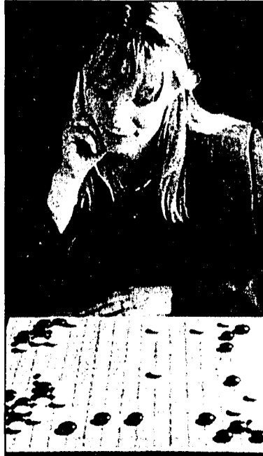
Im Gemeinschaftszentrum Resch in Schaan finden am Freitag, den 11. und am Freitag, den 18. Februar zwei Einführungsabende für das Brettspiel Go statt.