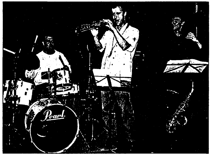
Während oben das Tanzbein geschwungen wurde, waren im Kellertheater des Vaduzer-Saales Jazz-Töne angesagt.