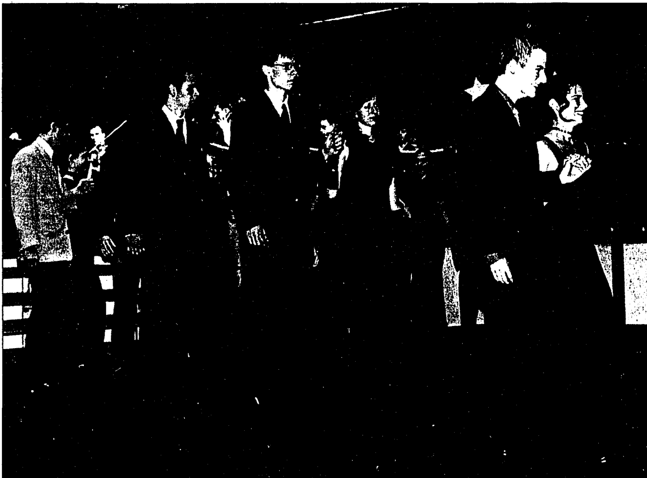
Bezaubernde Schritte in bezaubernden Roben: Einige Gymnasiast(-innen) bei ihrer Walzervorführung.