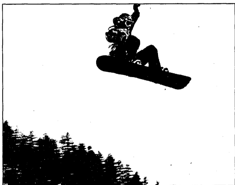
Auf der riesigen Schanze konnte man die Sprünge der Snöber bewundern.