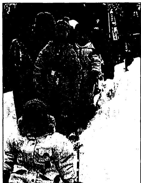
Eine «Schneefahrt», die ist lustig ...