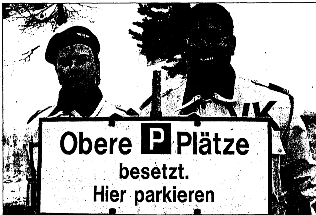
Zwar hätten es einige Besucher mehr sein dürfen, doch viele der Angereisten nahmen den Weg ins Malbun per Bus unter die Füsse respektive Räder.