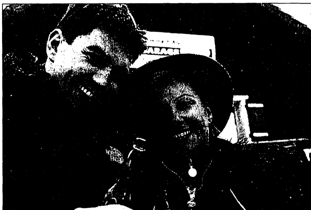
An Tomy's Bar war man mit einem Glühwein- oder Punsch-«Gluscht» genau an der richtigen Adresse: Von der guten Stimmung liess man sich auch nicht durch den anhaltenden Schneefall abhalten.