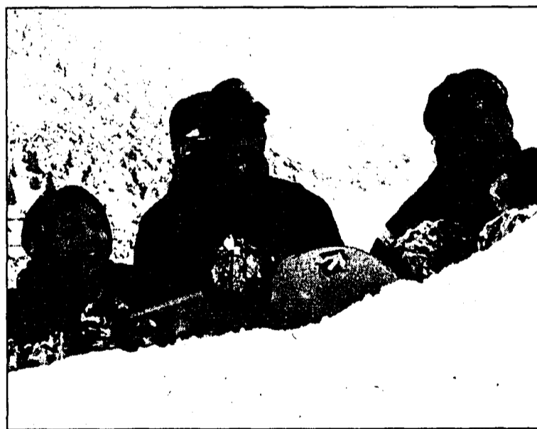
Wow, was der alles mit seinem Snöberbrett machen kann!