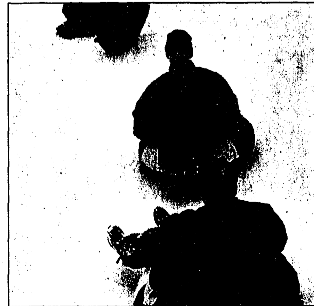
Auch die Autoschlauchfahrten sorgten für Begeisterung.