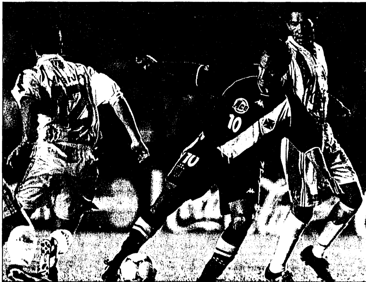
Die erste Weltmeisterschaft für Vereinsmannschaften erlebt ein rein brasilianisches Finale.

Vasco da Gama liess bei seinem dritten Sieg nichts mehr anbrennen, auch wenn es im zeitweise hochklassigen Spiel nach vier Minuten gar in Rückstand geraten war. Der ekwadorianische Spielmacher Alex