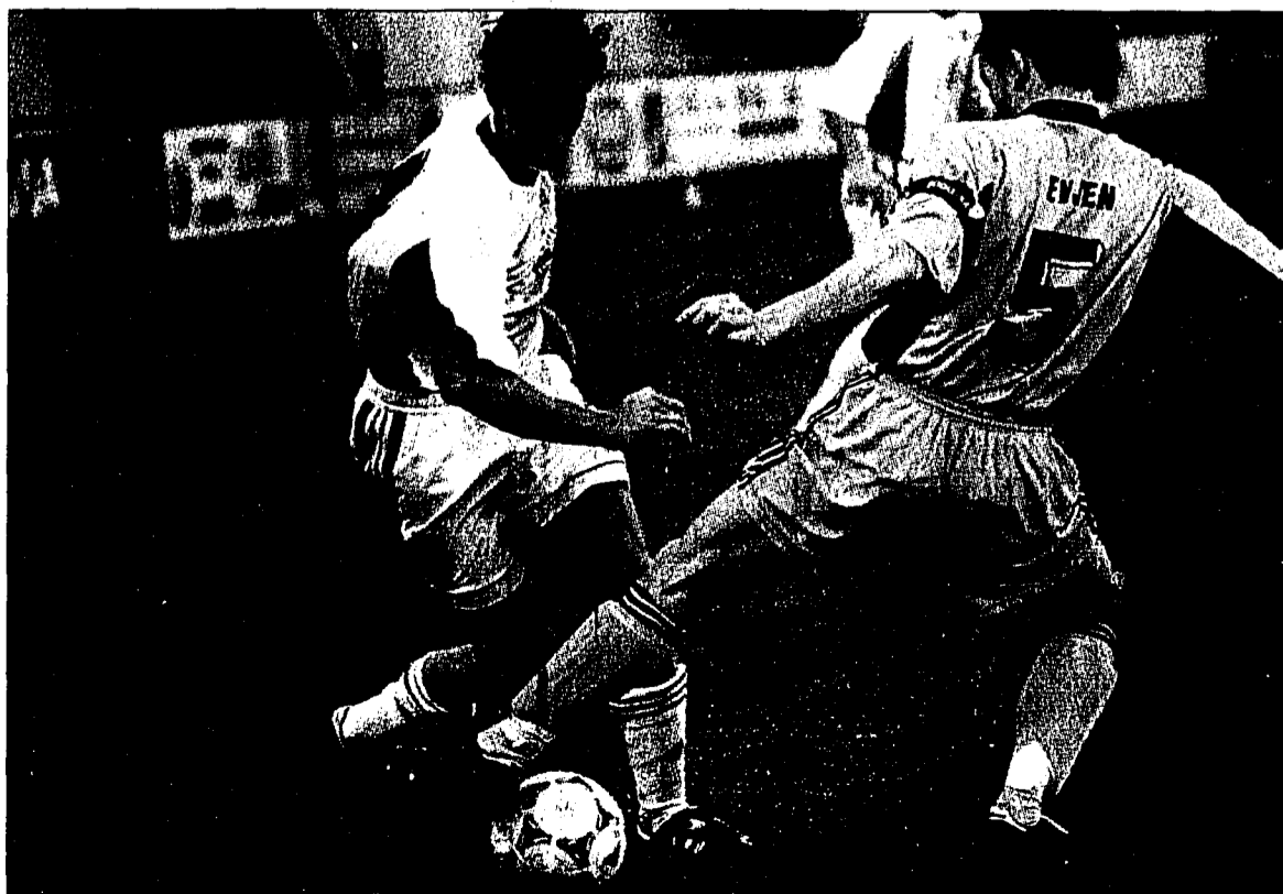
Die insgeheim erhoffte Überraschung blieb aus, denn nach dem allseits befürchteten Rückstand in der 28. Minute war der diesjährige Europacup-Traum des FC Vaduz praktisch schon ausgeräumt. Seite 13

FC Vaduz verliert im UEFA-Cup-Rückspiel gegen Bodø Glimt 1:2 (1:1)