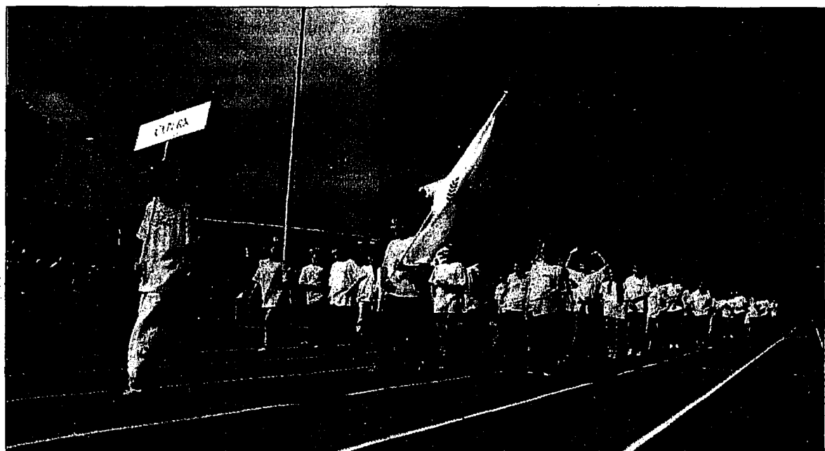
Bei strahlendem Sonnenschein wurden gestern die Mini-Games im Schaaner Leichtathletik-Stadion feierlich eröffnet. 1300 Schülerinnen und Schüler waren beim Aufmarsch der neun Kleinstaaten mit von der Partie. Seite 21

Gestern wurde in Schaan das Olympische Feuer entzündet