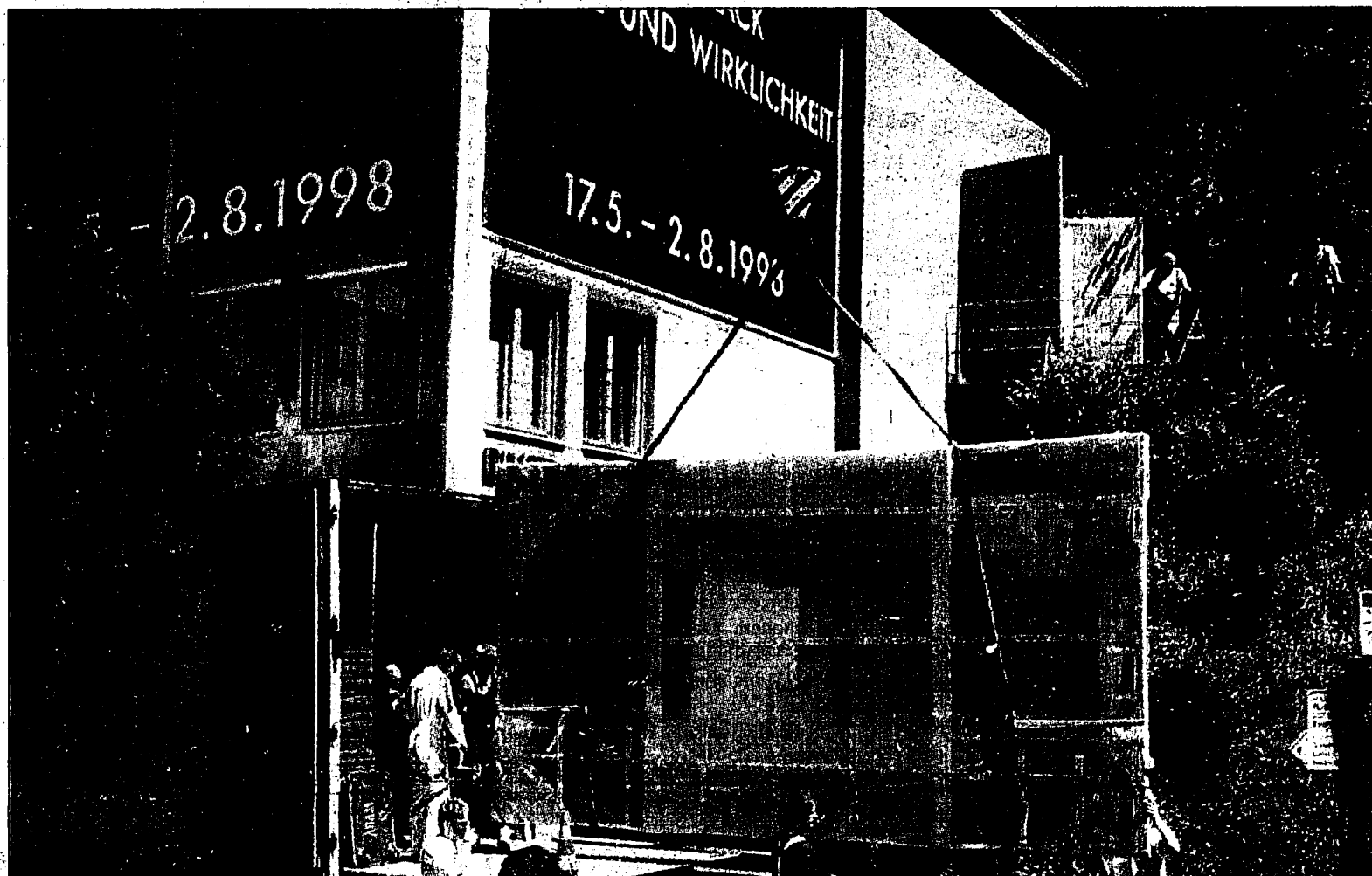
Sorgfältig verpackt und gesichert – so wurden gestern die Kunstwerke von Heinz Mack mit einem Kran aus dem Engländergebäude gehoben. Nach «Heinz Mack – Utopie und Wirklichkeit» folgt anfangs September die Ausstellung «10 Jahre Neuerwerbungen der Staatlichen Kunstsammlung», Mitte September dann die mit Spannung erwartete Mythologie-Ausstellung aus den Sammlungen des Fürsten von Liechtenstein.

Engländerbau für Mythologie-Ausstellung des Fürsten bereit