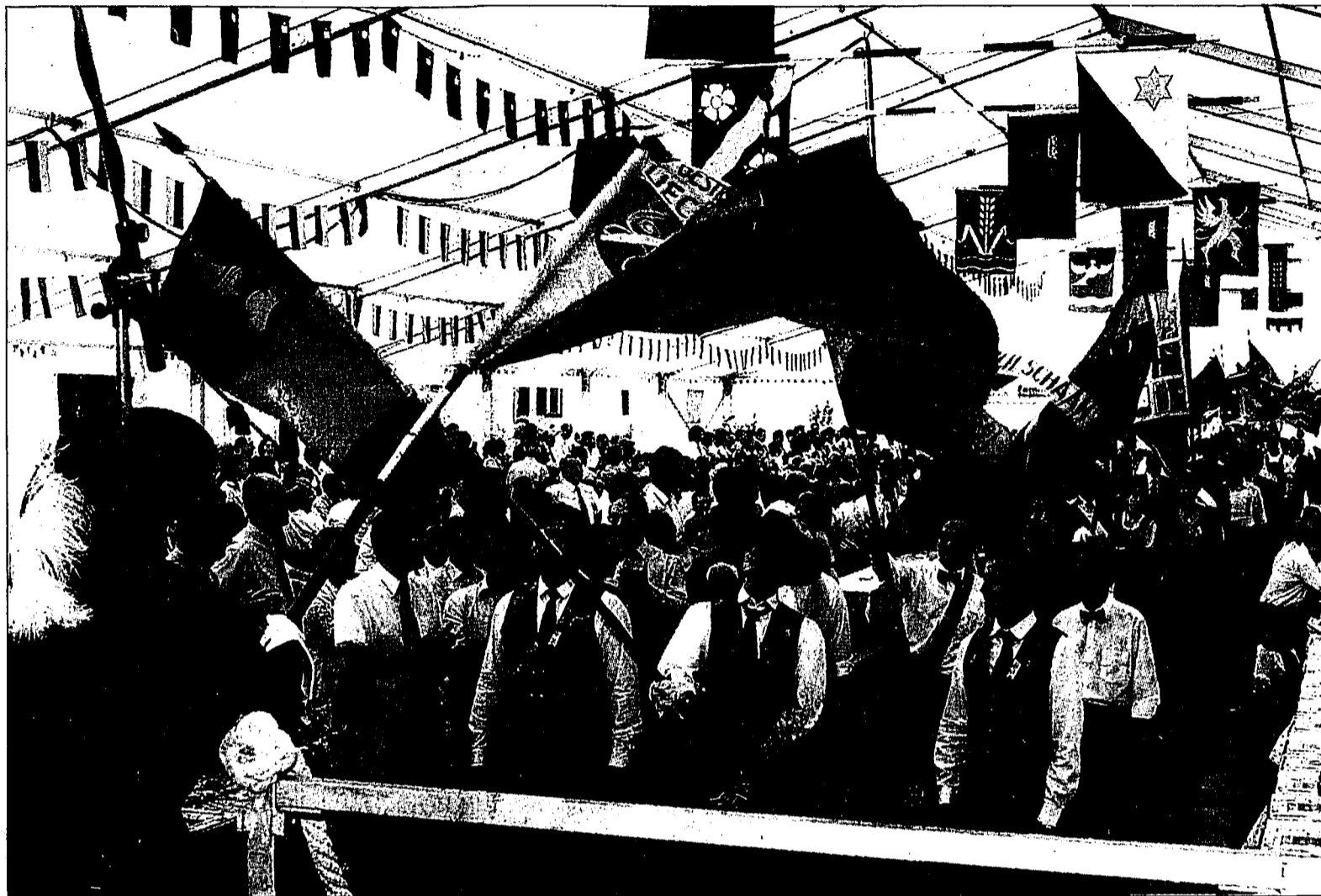
Am vergangenen Wochenende stand Mauren ganz im Zeichen des 39. Liechtensteinischen Bundessängerfestes. Auf Einladung des Gesangverein-Kirchenchor Schaanwald, der dieses Fest organisierte und durchführte, waren am Samstag 27 Chöre aus dem In- und Ausland zu Gast. Gestern Sonntag galt die ganze Aufmerksamkeit den 19 Kinder- und Jugendchören. Mehr darüber auf Seite 3.

Ab heute erhalten auch die Abonnenten in den Gemeinden Eschen und Planken das VOLKSBLATT mit Frühzustellung bereits am frühen Morgen. Nachdem nun zwei weitere Gemeinden hinzugekommen sind, wird das VOLKSBLATT fast im ganzen Land früh am Morgen an die Abonnenten verteilt. Wir wünschen auch unseren Leserinnen und Lesern in Eschen und Planken viel Vergnügen bei der morgendlichen Lektüre der Aktualitäten.