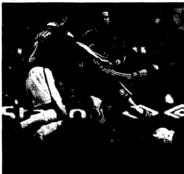
Manchester United setzte sich gegen Feyenoord zu Hause mit 2:1 durch.

Fussball-Champions-League: Erste Niederlage für Borussia Dortmund