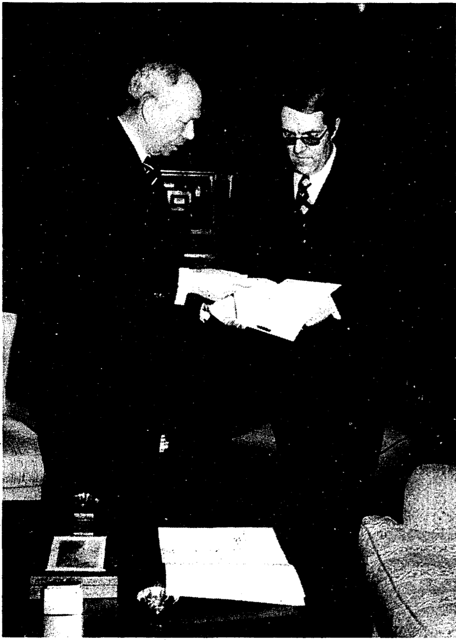
«S.D. Fürst Franz Josef II. hat sich nie gescheut, Verantwortung zu tragen und hat mit Integrität, Standfestigkeit, Wirklichkeitssinn und Weitblick die Geschicke unseres Landes gelenkt.» Eine Würdigung von Fürstl. Rat Dr. Walter Kieber (nach der Vereidigung als Regierungschef im Jahre 1974), von 1970 bis 1974 Regierungschef-Stellvertreter und von 1974 bis 1978 Regierungschef.

Zum Hinschied des Durchlauchten Landesfürsten – Eine Würdigung von Fürstl. Justizrat Dr. Walter Kieber, Regierungschef von 1974 bis 1978