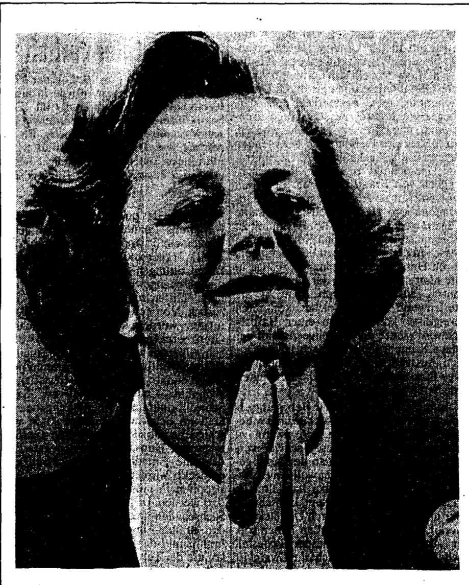
Margaret Thatcher, erster weiblicher Ministerpräsident West-Europas.

Warteschlangen hatte es bereits unmittelbar nach Oeffnung der Wahllokale um 7 Uhr vor einigen Wahlurnen gegeben. Gegen Mittag meldeten die Rundfunksender eine voraussichtlich hohe Wahlbeteiligung der rund 41 Millionen Stimmberechtigten