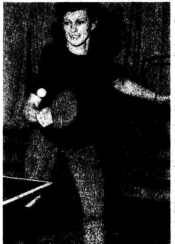
Die Klischees wurden von den Klischeeanstalten John & Co., St. Gallen, Messikommer Zürich und von der Rheintalischen Volkszeitung in Altstätten angefertigt.