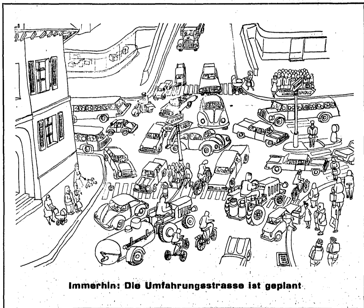
Immerhin: Die Umfahrungrasse ist geplant.