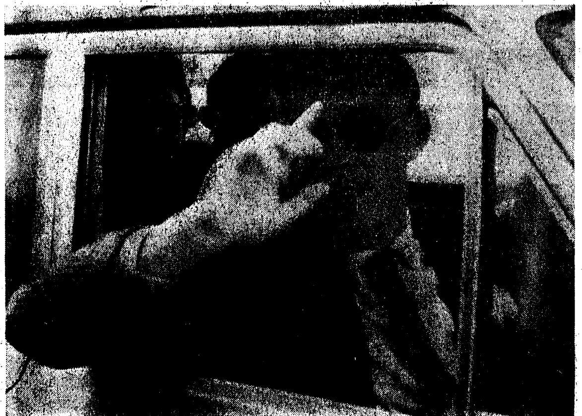
Bild unten rechts: Dieser Schnappschuss zeigt Königin Juliane und Prinz Bernhard der Niederlande am Grenzübergang in Schaanwald auf dem Weg zum Winterurlaub nach Lech am Arlberg.

Bild oben rechts: 10 Monate nachdem die einstige Holzbrücke abgebrannt war, wird die Notbrücke Ruggell—Salez erstellt.