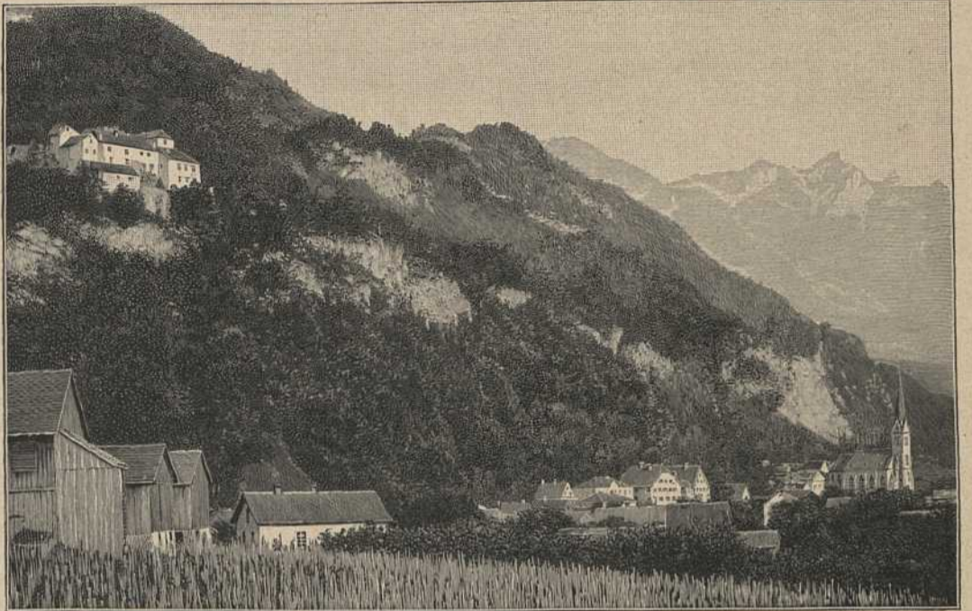
Schloß Vaduz nebst dem darunter liegenden Teile des Ortes.