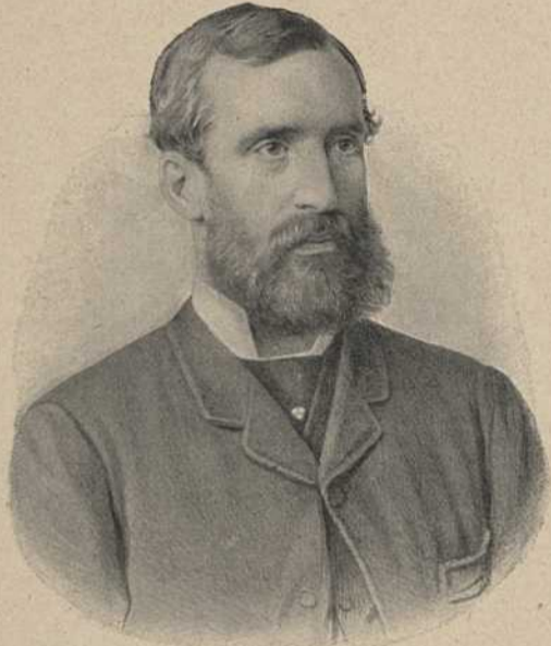
Fürst Johann II. zu Liechtenstein.