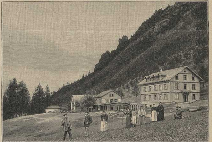
Kurhaus Gastei bei Vaduz.