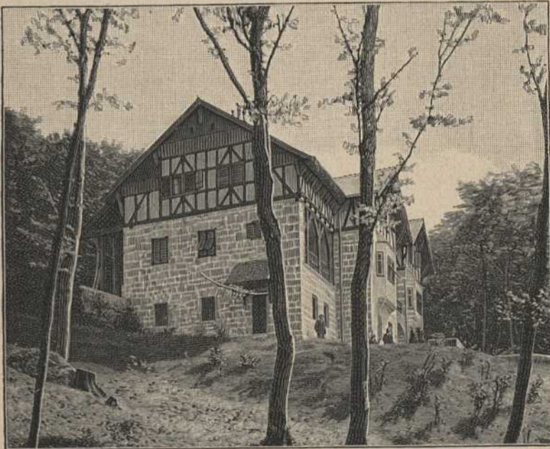
Fürstliches Jagdschloßchen oberhalb Vaduz.