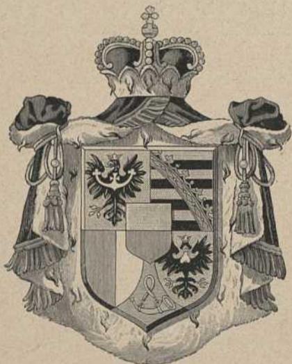
Das Liechtensteinische Wappen.