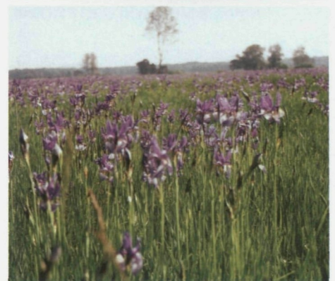
Einladende, paradisische Ansichten aus dem Liechtensteiner Unterland