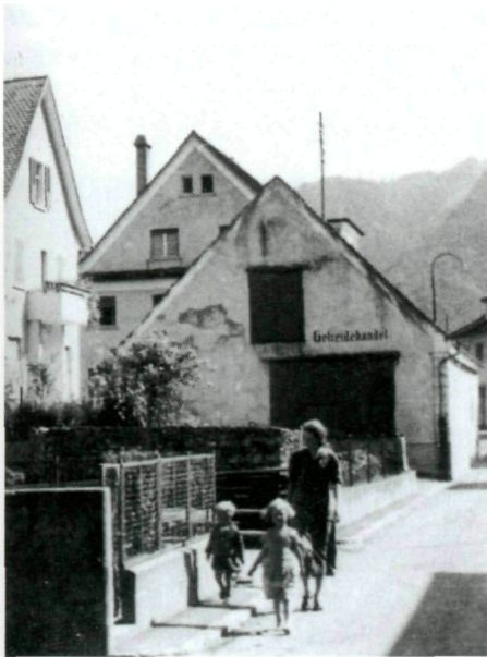
Die zum Gasthof «Post» gehörende Zuschg fiel in den 1950er Jahren einer Strassenverbreiterung zum Opfer.