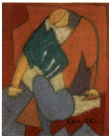
Adolf Hölzel, 1853–1934 Ohne Titel, um 1925/1930 Bleistift und Pastell auf Papier 14,4 × 11,7 cm Angekauft 1988