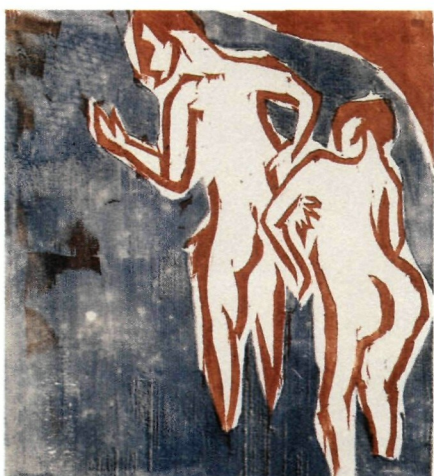
Ernst Ludwig Kirchner, 1880–1938 Badende, sich waschend (Moritzburg), 1910 Farbholzschnitt 31,5 × 25,5 cm Angekauft 1979