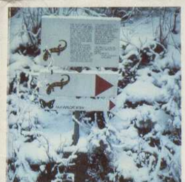
<< Hallenbad in Eschen < Naturlehrpfad in Schaanwald

Das Liechtensteiner Unterland ist ein guter Ausgangspunkt für Ausflüge in alle Richtungen. Der Hauptort des Fürstentums Liechtenstein, Vaduz, liegt nur wenige Kilometer in südlicher Richtung. Von Vaduz aus bestehen Strassenverbindungen in höher gelegene Dörfer mit alpinem Charakter. In