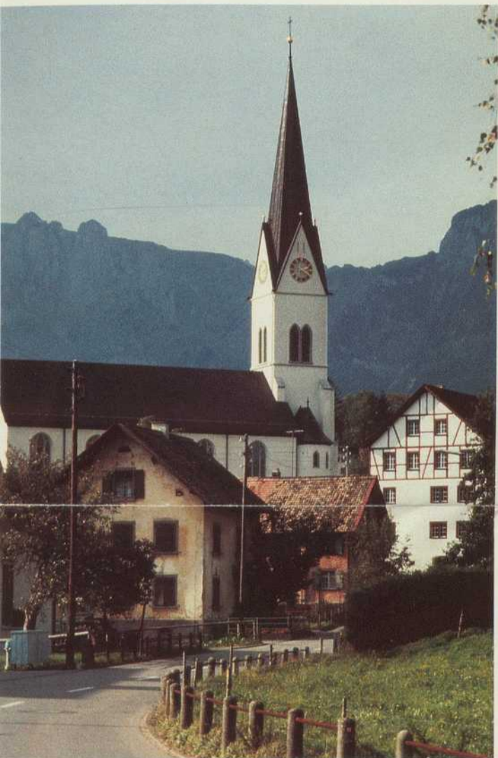
Gebirge, über Riete und Hügel, durch Auen, an Bächen, Kanälen und am Rhein entlang.

Am beschaulichsten lässt sich das Liechtensteiner Unterland mit dem Fahrrad entdecken. Ein gut ausgebautes Netz von Fahrradwegen bietet Ruhe und Sicherheit auf den Ausflügen. Die Dörfer liegen nahe beieinander, sodass jeder Winkel des Liechtensteiner Unterlandes mit dem Fahrrad gut erreichbar ist. Besonders zu empfehlen ist eine erhabene Fahrt auf dem verkehrsfreien Rheindamm, der den Blick auf Kiesbänke und Wasserlauf des Rheins ebenso freigibt wie auf Auenwälder, Dörfer und Ackerland. Für weitere Fahrten stehen Postbusse zur Verfügung, die in kurzen Zeitabständen und zu einem sehr günstigen Tarif im Fürstentum Liechtenstein verkehren.