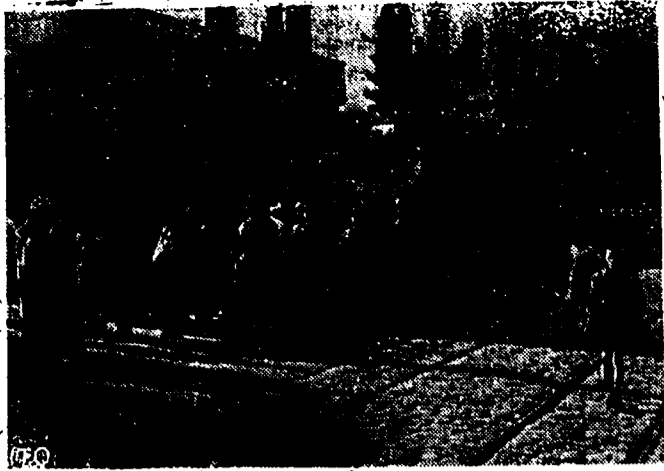
March deutscher Truppen durch Tunis. Ein weiteres Kontingent deutscher Truppen ist in Tunis eingetroffen. Eingehend marschieren die Soldaten durch die Stadt.