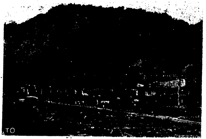
Dieses Bild von der waffenstarrenden amerikanischen Inselfestung Corregidor in der Manila-Bucht zeigt deutlich die vernichtende Wirkung des angelangenen Artilleriebeschusses durch die Japaner.

Wie stark diese sind, wird freilich nicht angegeben, doch sollen sie sich gut halten. So war bei der Sechsten Armee ein turkestanisches Bataillon, das sich bis zum letzten Mann geschlagen habe. Jedes Volk bildet einen eigenen Verband. So will man offenbar die zentrifugalen Kräfte der Sowjetunion auswerten und fördern. Die Eidesformel des Fahnenreides, den diese Truppen leisten müssen, lautet: