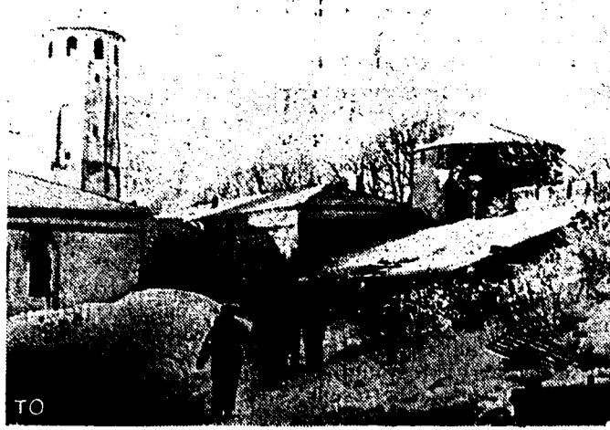
Ablösung nach vorn. Aus den noch erhaltenen Zeilen einer Burg an der Ostfront, die für die deutschen Soldaten als willkommene Unterkunft dient, tritt der Ablösungstrupp in die Winterform.