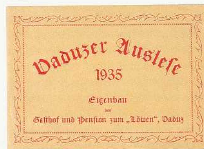
Abbildung 39: Eigenbau. Etikette für die Vaduzer Auslese des "Löwen", Vaduz