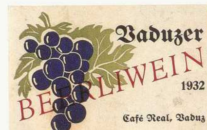
Abbildung 38: Lange Tradition. Frühe Etikette für den Ausschank des Vaduzers im "Real", 1932